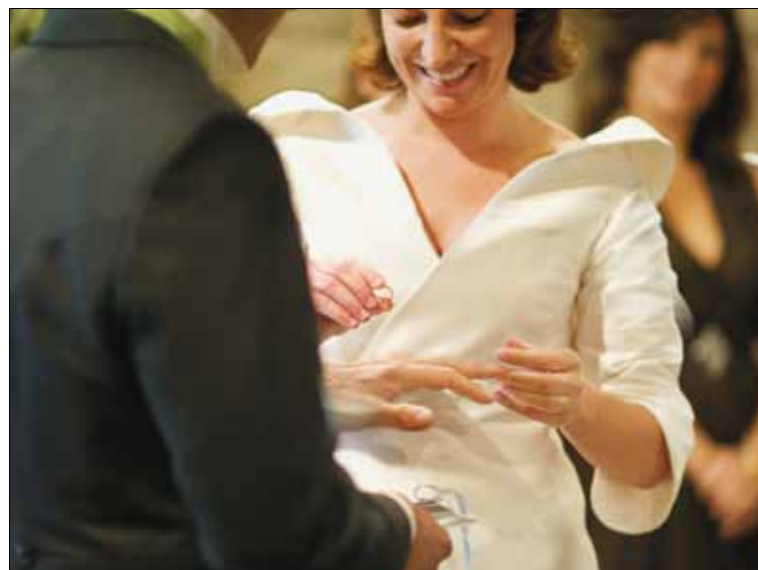
Kwart burgerlijke huwelijken krijgt religieus vervolg.

Daarbij motiveert ze haar pleidooi verder: „Wanneer het er op aankomt die twee getuigen te kie-