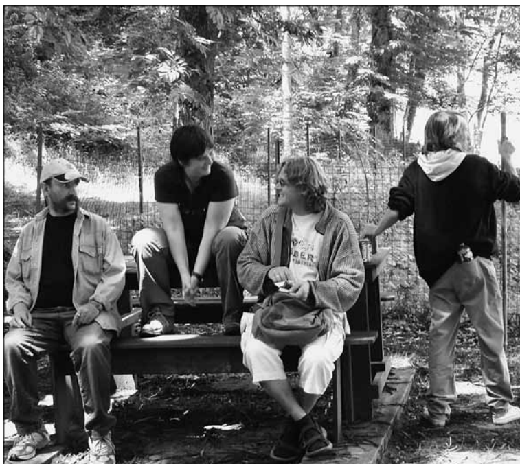
Ieder liet zich op zijn manier raken.