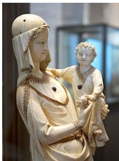
Madonna uit de Sainte-Chapelle, voor 1279, Musée du Louvre, 41 cm.

Dat is een boodschap van hoop regelrecht tegen het pessimisme in. Hoop omschrijf ik graag als 'bij voorbaat van de toekomst genieten'. Hoop en optimisme zijn uiterst belangrijk omdat veel resultaten in ons leven afhangen van de hoeveelheid optimisme die we opbrengen en van