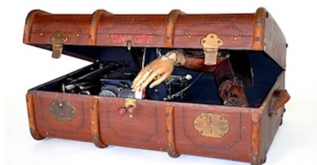
Claude Shannon, the Useless Machine, 1950', Bell Laboratory Een latere leuke maar duidelijke remake uit 2003

Shannon, hoe geniaal ook, was niet de eerste uitvinder van het AAN-UIT principe. Johannes de Doper, één van de centrale figuren in deze Advent, ging hem daarin voor. Hij zag het als zijn taak in beweging te komen en daarna zichzelf uit te schakelen. Niet uit een soort van ziekelijke zelfontkenning of omdat hij zichzelf nutteloos of onbelangrijk vond. Maar Johannes zet zichzelf opzij omdat hij iemand groter ziet. "Na mij komt iemand die veel machtiger is dan ik", zegt hij in het evangelie van deze zondag. Hij kent zijn plek omdat hij gelooft dat Jezus veel meer dan hij in staat zal zijn om te wijzen op wat God aan het doen is in de wereld.