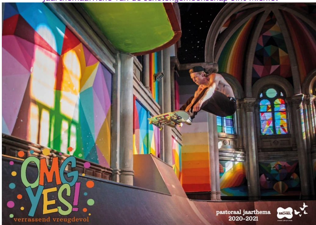
jaartheemaaffiche van de scholengemeenschap Sint-Michiel

In vrije basisschool 'De Gulleboom' kreeg elk kind (jaarlijkse gewoonte!) een sleutelhanger om aan de boektas te hangen met het nieuwe logo van het jaarthema.