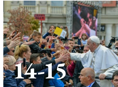
'Wees gegroet, Maria' F. Fabry