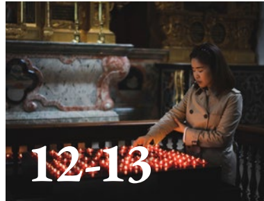
Maria-Lichtmis: einde of begin? G. Narinx