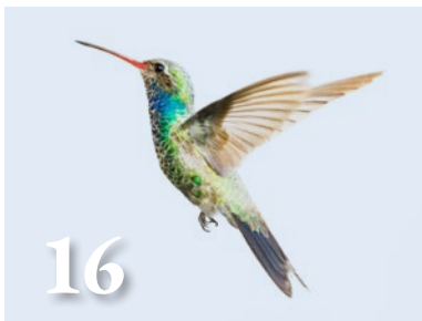
Let eens op de vogels A. Rubbens