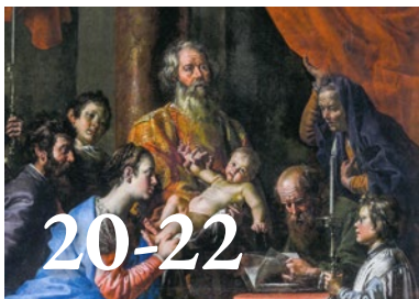
Wees gegroet ... in Scherpenheuvel