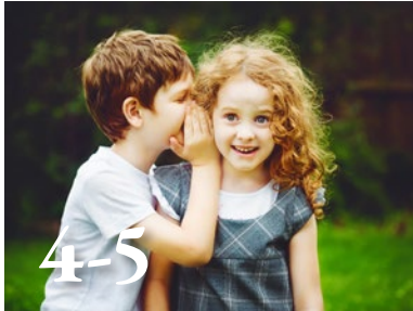
Montforts geheim F. Fabry