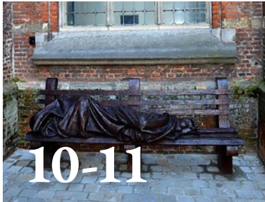
Wat als Jezus een dakloze was? G. Geeraerts