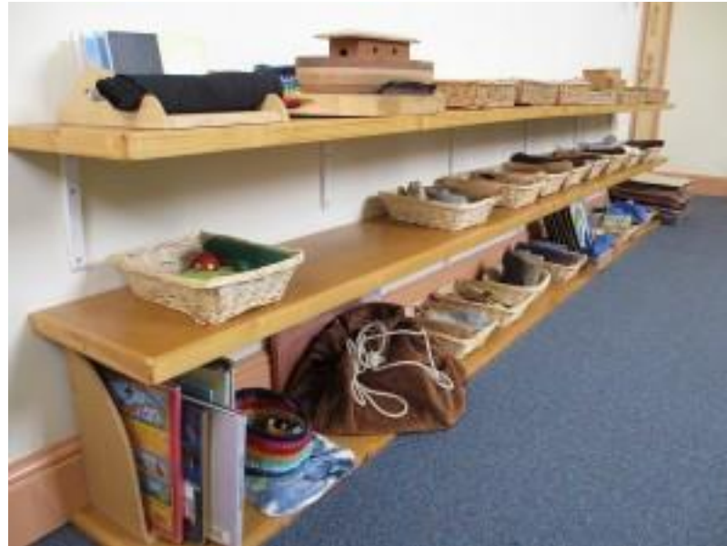
Planken aan de muur ... dat kan ook!