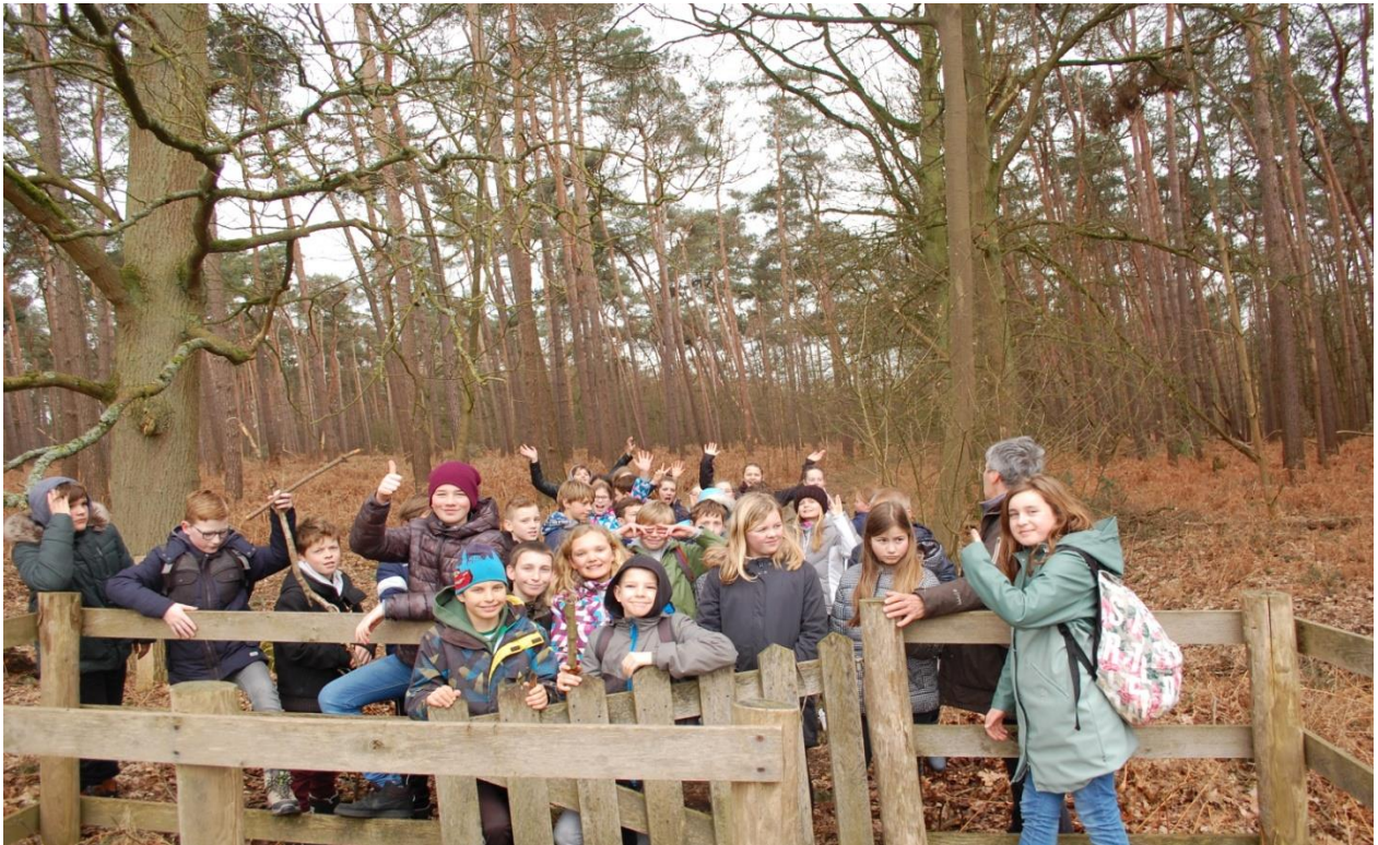
(Sponsortocht : een fotootje van vorig jaar...)