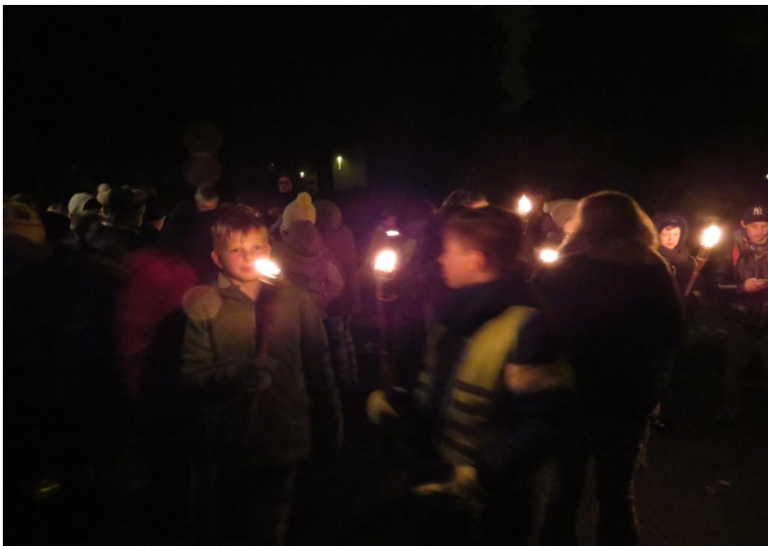
(een fotootje van vorig jaar)

We vertrekken om 19 uur stipt aan de Heilig Hart kerk Kruisstraat en zijn terug rond 21 uur. Dat verdient een warme tas chocomelk !