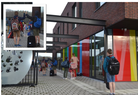
Uit: Leeftocht, september 2018

Lees online het artikel Gastvrijheid van Herman Beck op www.alnisa.nl/gastvrijheid .