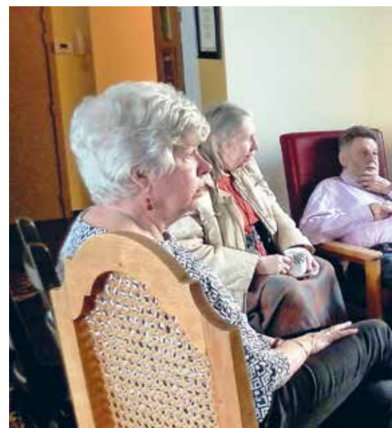
Vrijwilligers en bewoners samen gezellig aan het napraten

“Met de bewoners komen we samen voor de koffieklets, onze vergadering. In het begin was het vooral mijn rol om het samenleven te coördineren. Omdat ze mekaar niet kenden, hebben we in het begin wekelijks dingen samen besproken: de kleur van de verf voor de gemeenschappelijke ruimte, de vraag of er beneden een TV moest komen of