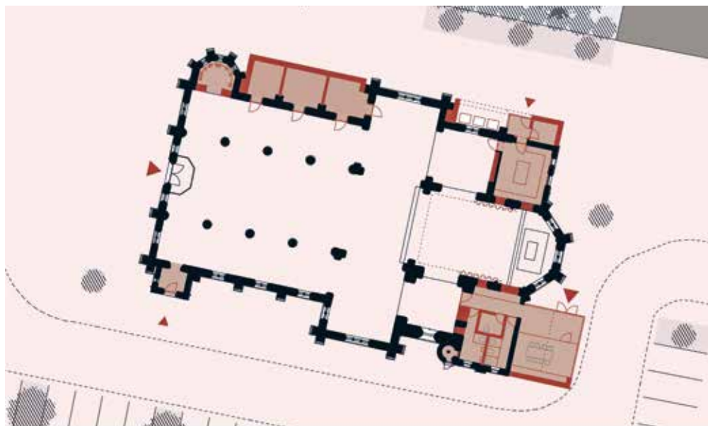
Aanpassingen in de kerk volgens het eerste scenario.

In Rijkevorsel werd voor de Sint-Jozefkerk een studie gevraagd bij het Projectbureau. “Rijkevorsel is relatief klein en heeft twee kerken en een kapel. In