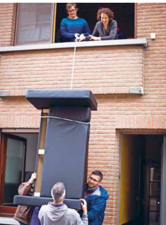
"Vrijwilligers helpen niet alleen om een woning te vinden. Ze steken ook een handje toe bij de verhuis."

"Vergeleken met de collectieve opvang bood de opvang in een LOI veel meer kans op lokale binding. Dit steeds verder afbouwen, zal de integratie niet vlotter doen verlopen. Telkens wanneer men een asielzoeker of vluchteling overbrengt naar een andere locatie wordt alles, wat er aan ondersteuning werd opgebouwd, onderuit gehaald. Op termijn kan dit ook