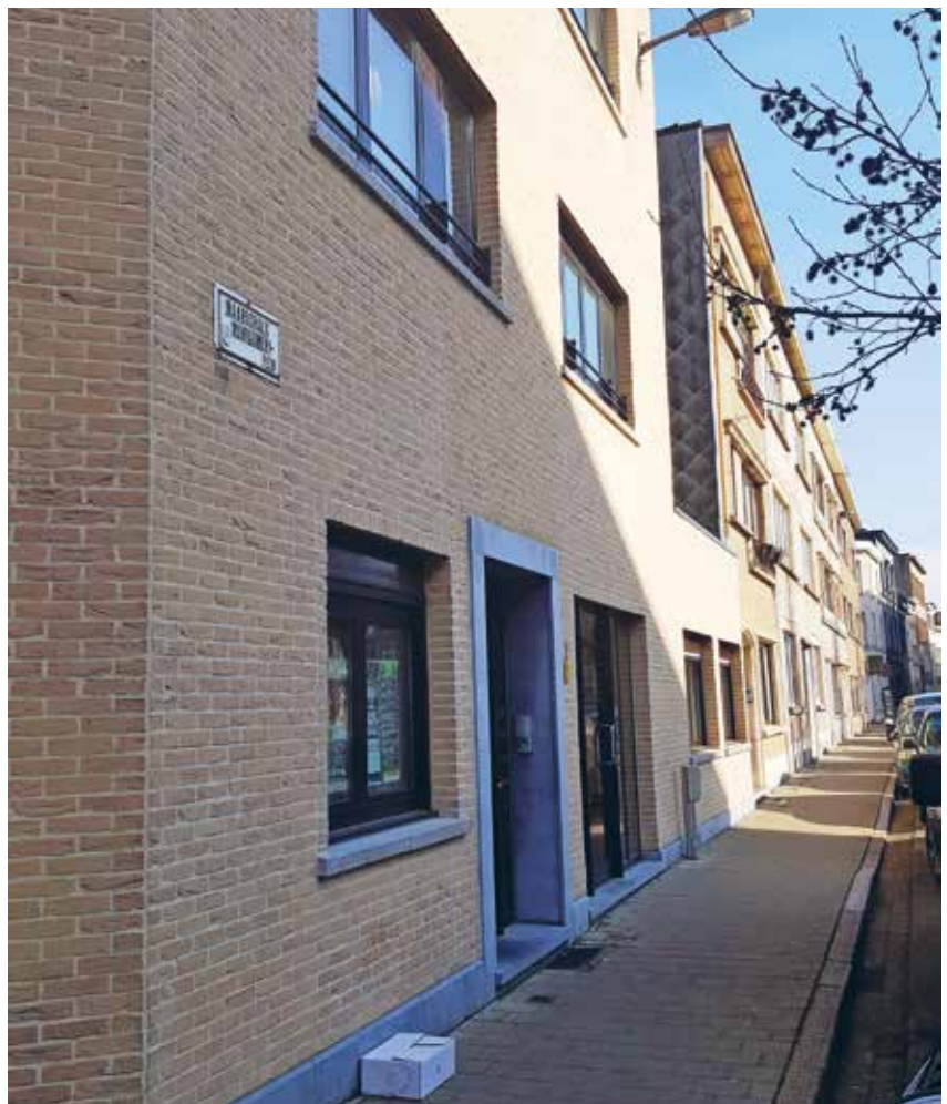
Senioren-Thuis in Borgerhout.

Caritas International heeft het model Housing Café verder uitgebouwd om erkende vluchtelingen te begeleiden bij het zoeken naar een eerste woning. Orbit vzw werd een partner in de strijd voor meer huisvesting via het begeleidingsproject 'Woning gezocht, burens gevonden'. Ten slotte komen twee parochies aan het woord. Ze zagen allebei de kans om enerzijds een woning te verhuren aan een gezin erkende vluchtelingen en om anderzijds een groep mensen samen te brengen om deze gezinnen alle kansen op integratie te helpen geven.