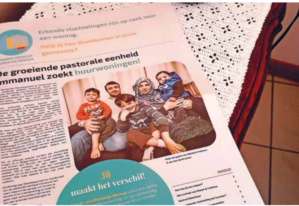
Voor hun projectoproep maakte de groep een krantje in samenwerking met Orbit vzw.