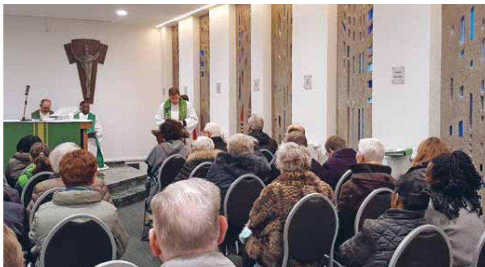
Bij de feestelijke opening stroomde de nieuwe kerk helemaal vol.

In ieder geval, ik zou iedereen adviseren om te durven dromen. We hebben dit project niet gemaakt voor de komende vijf jaar. We weten ook niet wat er met de andere kerken in de buurt zal gebeuren, hoeveel priesters er zullen zijn, hoeveel medewerkers en verenigingen. Nu hebben we bijvoorbeeld ook nog een parochiehuis. Ook daarvan kan je niet zeggen hoelang we dat kunnen blijven dragen. Daarom vond ik het belangrijk om hier een kleine keuken toe te voegen. Mensen zullen immers altijd een plek nodig hebben om samen te komen. Dat kan dan ook hier. Heel dit verhaal zit in een spanning tussen vasthouden en loslaten en is breder dan we enkel hier bekijken. Mijn ervaring is dat mensen zich in de stad gemakkelijker bewegen. Bij elke verandering zoeken ze hun plaats. Wie weet komen ze ook hier terecht. Ze zijn welkom!”