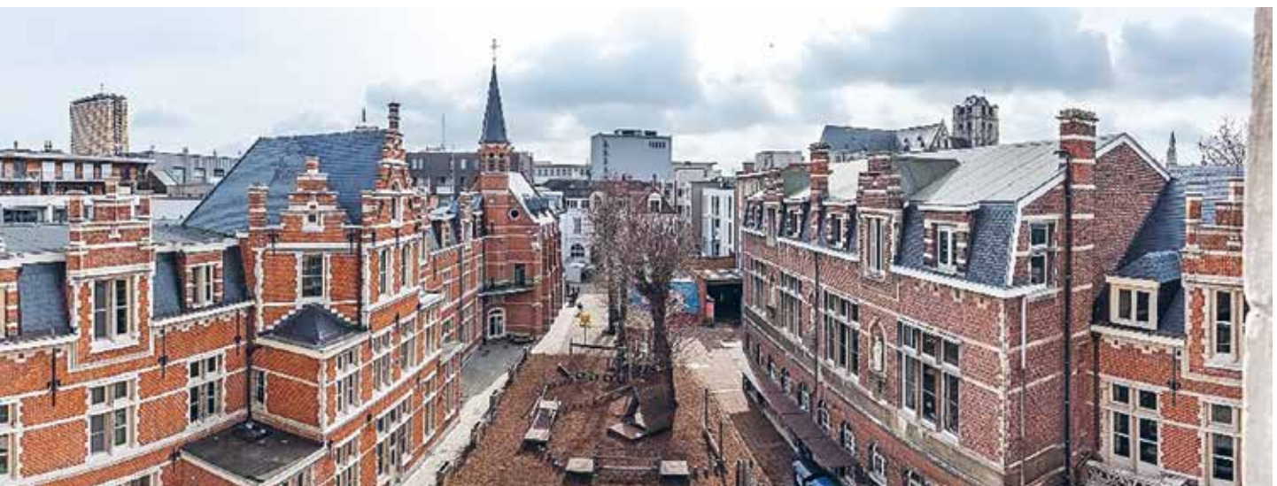
Site voormalig klooster Apostelinnen van Antwerpen.

Emmaüs Regio Antwerpen besloot om de gebouwen grondig te renoveren en zo de aan hen toevertrouwde jongeren optimaal op te vangen. De Apostelinnen van Berchem vestigden zich met de laatste zusters in 1999 in een nieuwbouw. Vanuit hun engagement in de Sint-Vincentiusvereniging blijven ze een gemeenschap die openstaat voor de noden van de buurt. Ook de laatste zusters van de contemplatieve Orde van de Maagd Maria wonen sinds 1999 in een nieuw gebouwde Monasterium Magnificat in Malle. De oude kloostergebouwen werden door de Broeders van Liefde omgebouwd tot huisvesting voor enerzijds psychiatrische patiënten en anderzijds zwaar gehandicapte jongvolwassenen. In Berlaar bouwden de zusters van het H. Hart van Maria voor hun school de nodige nieuwe gebouwen. Voor de ouder wordende zorgbehoevende zusters werd het woonzorgcentrum Kloosterhof gebouwd. Het klooster wordt nu opgeruimd. Het zoeken van een nieuwe invulling voor het grote klooster verliep via een lang proces van studies, overwegen en beslissingen nemen.