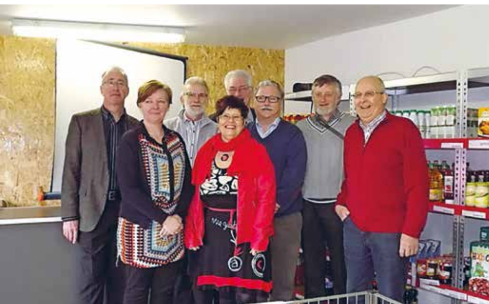
De vzw De Molen wordt bestuurd door een stevige ploeg vrijwilligers.

"Bij ons komen wekelijks een 35-tal mensen kopen. Ze kunnen kiezen uit ongeveer 400 producten. We kopen aan bij lokale grootwarenhuizen, in grote verpakkingen, die wij dan opnieuw verpakken tot kleinere porties en hoeveelheden. Onze prijzen liggen 20% lager dan we het product zelf hebben aangekocht. We kijken heel goed na waar we zelf het goedkoopst kunnen kopen. Van de handelaars krijgen we bovendien extra steun. Toen de Aldi werd verbouwd, kregen we zoveel rekken,