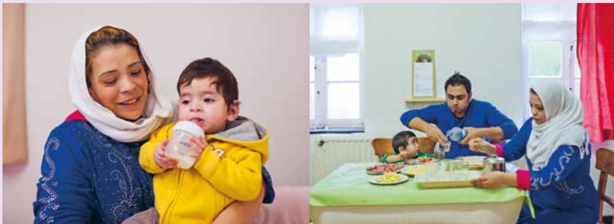
Bron: www.caritasinternational.be/nl/asylum-migration/een-woning-vinden-mission-impossible.