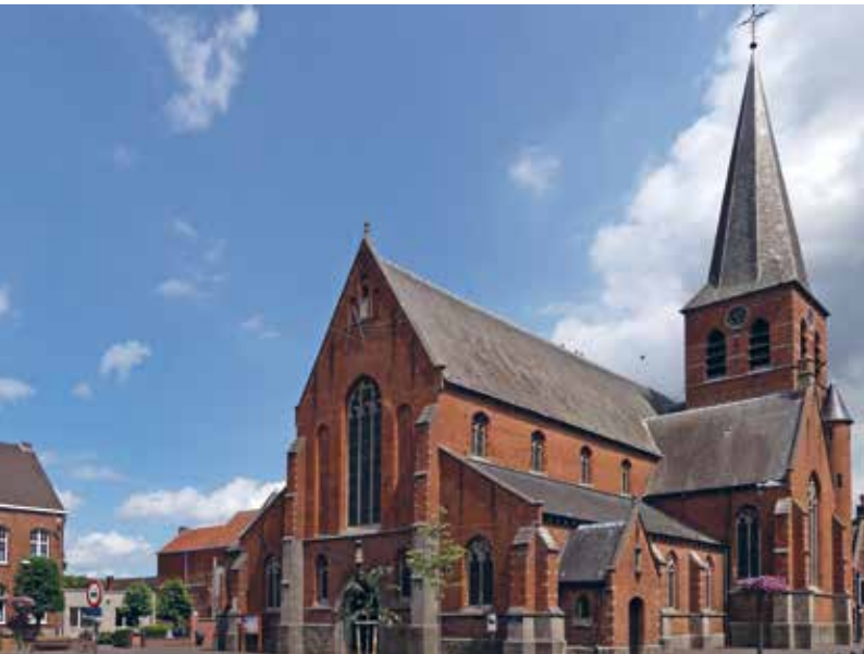
De Sint-Jozefkerk in Rijkevorsel bepaalt het dorpsgezicht.