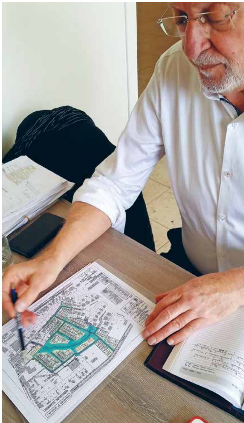
Verkavelen rekening houdend met lokale noden.

“Na die twee ondersteuningsvragen zijn we gaan nadenken. Daaruit is, gedateerd op 23 september 2015, onze Strategische visie 2020 tot stand gekomen. De visie is omvattend en