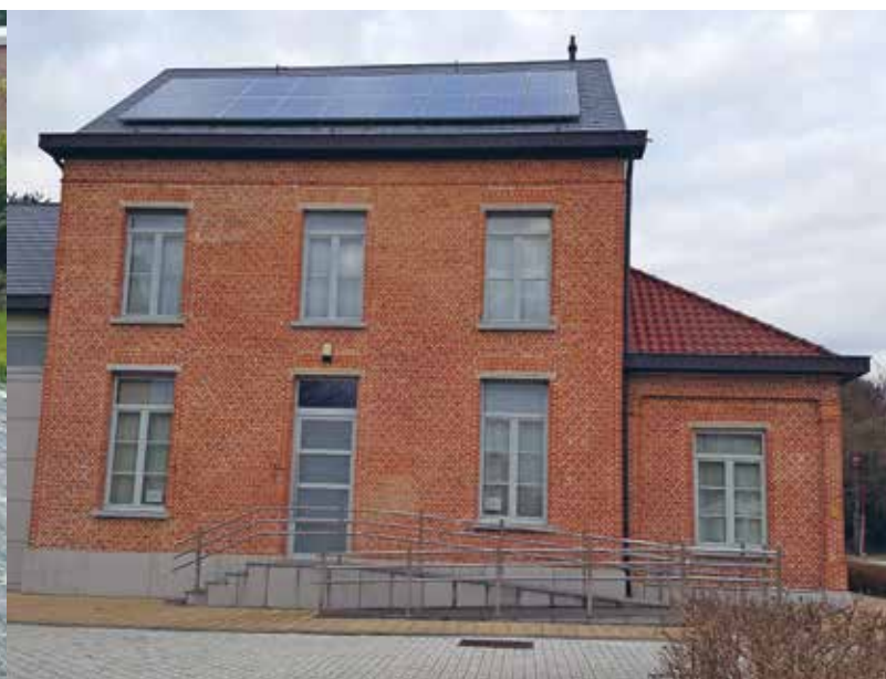
In Hulshout vindt de koffiebabbel plaats in de pastorie.