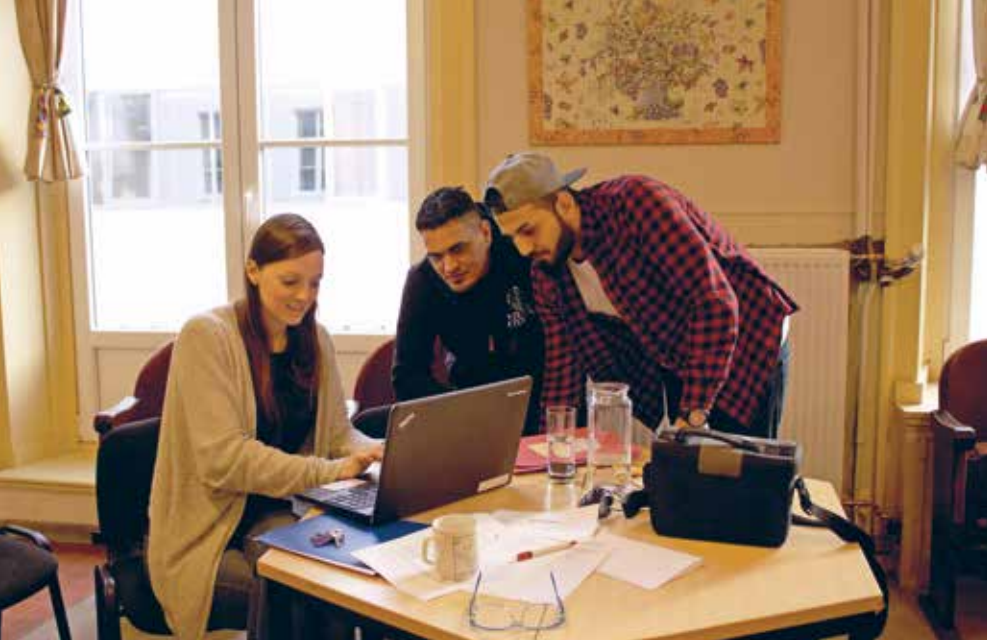
Erkende vluchtelingen zoeken samen met een begeleider van het Housing Café op internet naar een geschikte woning.

gevonden hebben kunnen ze bij ons terecht met vragen over het contract, de nutsvoorzieningen,..."