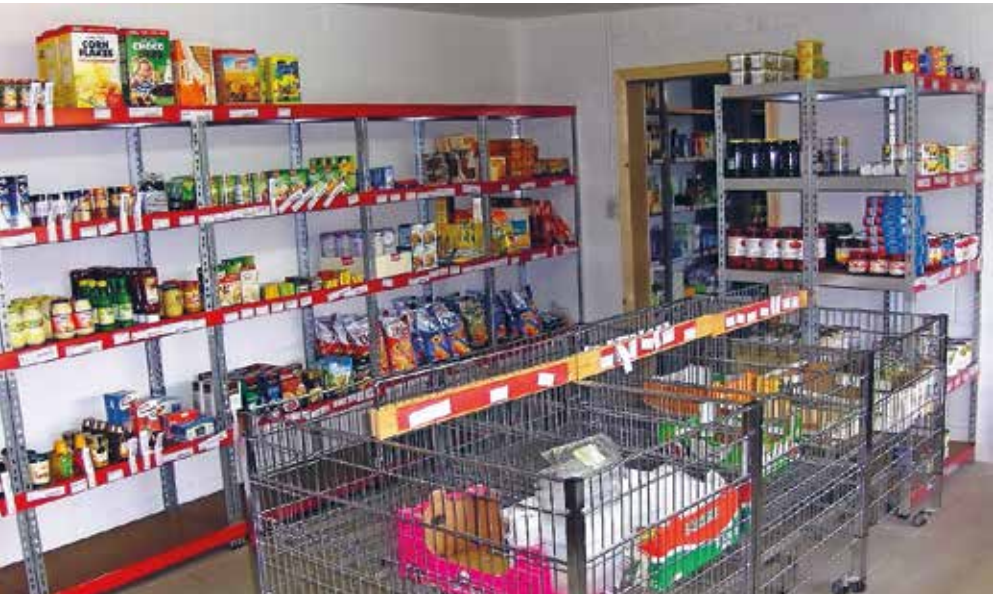
De winkel werd reeds tweemaal vergroot en biedt wekelijks aan 35 mensen de kans om goedkoop inkopen te doen.

bakken en diepvriezers als we konden gebruiken. Ook producten krijgen we regelmatig gratis aangeboden: Bostorijst, paaseieren. Ook voor gratis gekregen producten vragen we een lage prijs. Het is dan ontroerend te zien hoe een mama zo gelukkig is en zegt: "Hoeveel jaar is dat geleden, dat ik aan mijn kindjes paaseieren heb kunnen geven." Carrefour biedt ons producten aan die nog enkele dagen goed zijn. Vaak gaat het echter om grote hoeveelheden. Dan moeten we goed nadenken of we ze zelf nog verwerkt krijgen of niet. We hebben bijvoorbeeld nog altijd Bostorijst staan. Van een bakker krijgen we op dinsdagavond het overschot aan brood. Dat vriezen we in. Een beenhouwer vriest overschotten al zelf in porties voor ons in. Je ziet hieraan dat we op veel sympathie kunnen rekenen en dat samenwerkingen en afspraken steeds verder groeien."