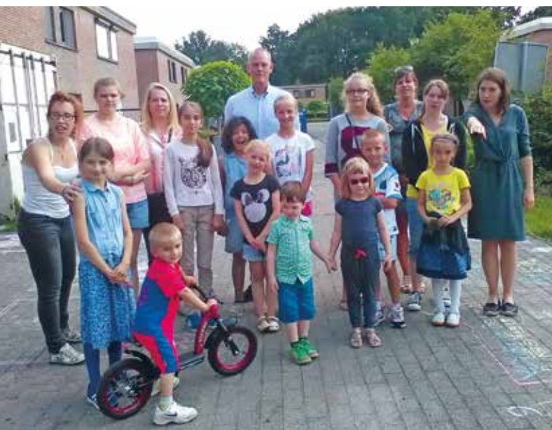
Tijdens de zomer organiseren jongeren straattekenen, een activiteit die voor iedereen open staat.