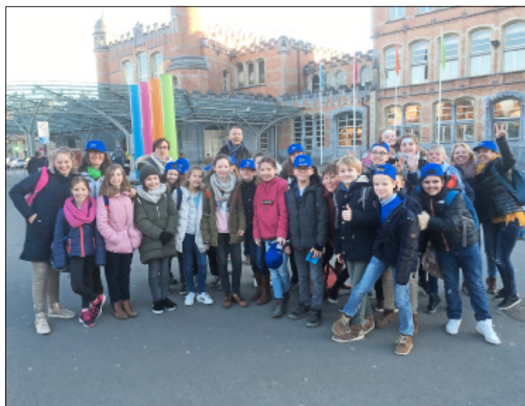
Blijge gezichten op deze groepsfoto na een zonnige BAVOdag