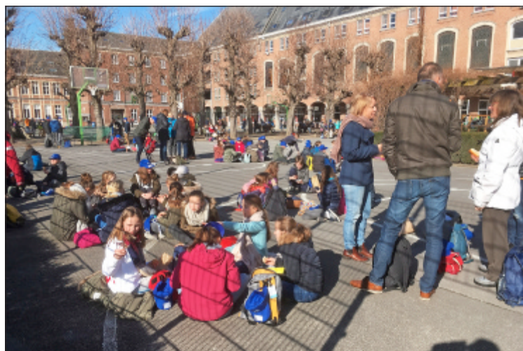
Na een mooie slothapping was de tram ons vervoermiddel om terug te keren naar het Sint-Pieterstation.