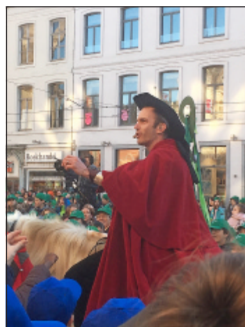
Aankomst van Sint-Bavo op het Sint-Baafsplein

Was de dag zoals je verwacht was? Ik had niet echt verwacht dat we met zoveel zouden zijn Wat heb je allemaal gedaan? We zijn met de trein naar Gent geweest, hebben een paar toffe liedjes geleerd en een uur lang leuke spelletjes gespeeld in