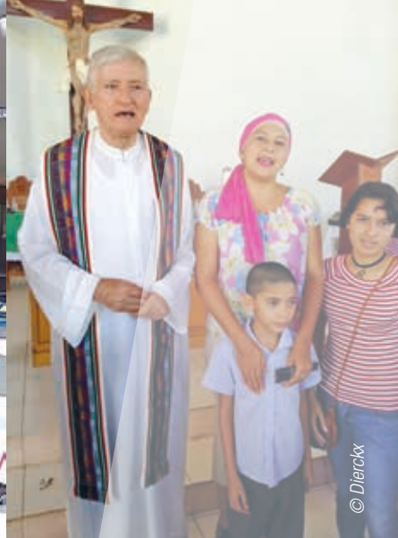
› Een lokale catecheseploeg