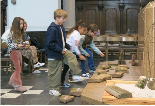
Ook de 1 ste communicanten dragen letterlijk hun steentje bij aan dit pad.