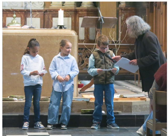
Het voorlezen van de voorbeden