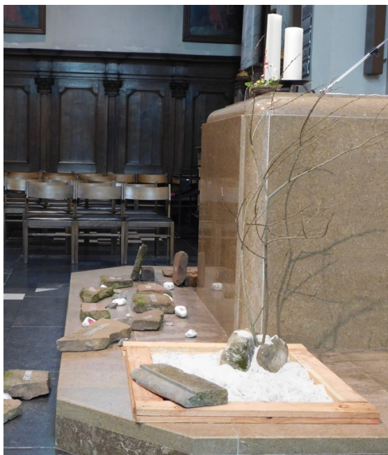
Wemmel, Sint-Servaas

Er ligt nu een grote zware steen in onze compositie, wat staat voor de negatieve kracht van het ongeloof en het defaitisme, dat ons al eens passief en levenloos maakt.