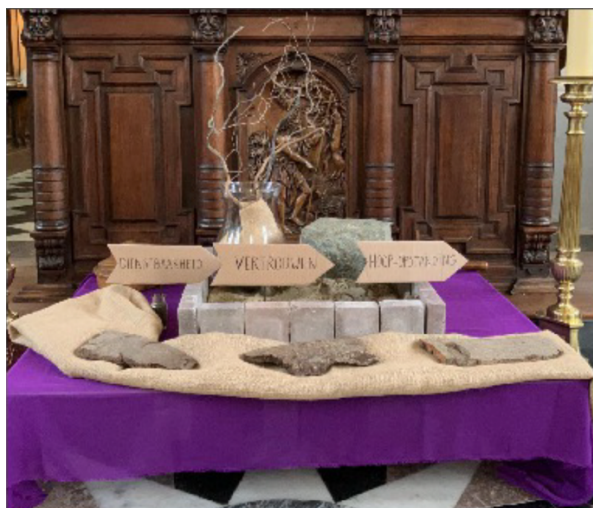
Ossel, Sint-Jan-De Doper