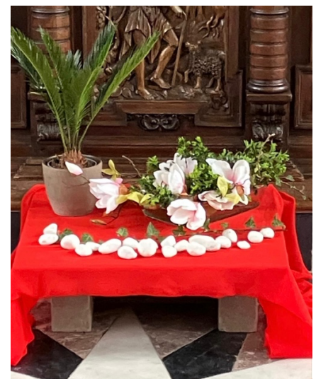
Ossel, Sint-Jan de Doper