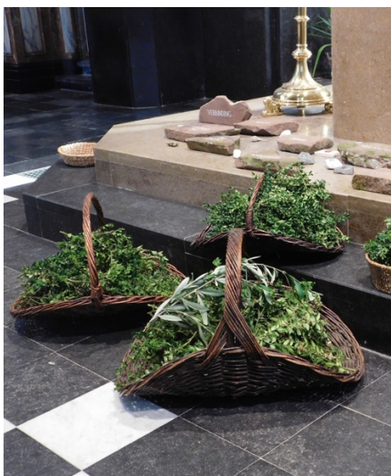
Wemmel, Sint-Servaas