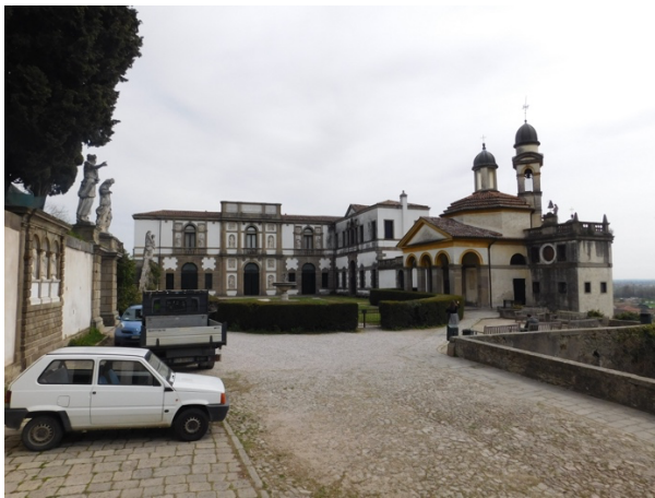
De kerk, de laatste statie

Op de helling van de Colle della Rocca, de heuvel met bovenop een groot fort, bouwde de Venetiaanse patriciër Pietro Duodo (1554-1610) een grote villa. In 1605 verkreeg hij de pauselijke toestemming voor een bijzonder project : het Santuario Giubilare delle Sette Chiese, het heiligdom van de zeven kerken. Op de weg die omhoog loopt naar het plein voor de villa en naar de kerk van San Giorgio, liet Duodo zijn architect, Vincenzo Scamozzi, zes kapellen bouwen. Samen met de kerk, waren dit zeven gebedshuizen.