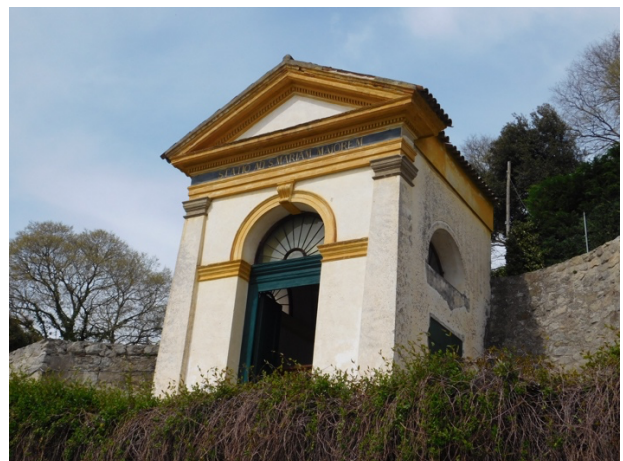
De 'statio' ad Sanctum Mariam Majorem (Santa Maria Maggiore)

Een bul van paus Paulus V verzekerde de pelgrims dat een bezoek aan de Sette Chiese van Monselice dezelfde volle aflaat opleverde als een bezoek aan de zeven pelgrimskerken in Rome – een uniek voorrecht in de wereld. Op het portaal aan de ingang van de zogenaamde Via Romana is er dan ook een Latijnse inscriptie aangebracht : Romanis Basilicis Pares (de gelijken van de Romeinse basilieken). Waar een pelgrim in Rome (op één dag) de hele stad moest doorkruisen en zo'n 25 km te voet moest stappen, kon hij in Monselice al een volledige aflaat krijgen voor zijn zonden door zo'n 200 meter te stappen. En voor alle duidelijkheid : voor een volle aflaat in Monselice is ook een bezoek aan de San Giorgio verplicht.