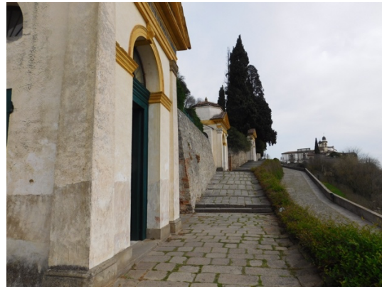
Een zicht op de kapelletjes

Dit werd opgelost door één van de kapellen zowel aan Petrus als aan Paulus te wijden, die allebei een basiliek hebben in Rome. Maar voor alle duidelijkheid : voor een volle aflaat in Monselice is ook een bezoek aan de San Giorgio verplicht.