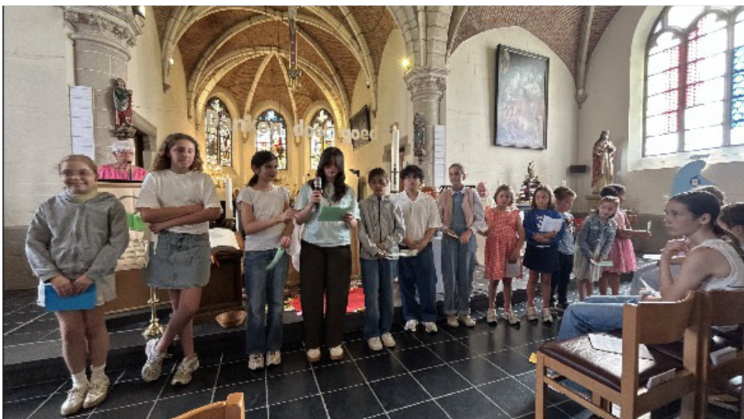
Met een mooie dankviering sloten de vormelingen en de eerstecommunicanten hun werkjaar succesvol af

Het zal wel zo zijn dat iedere vergelijking mankt loopt. Maar laat me dit toch eerst even kwijt. In het Laatste Nieuws van 28 mei 2026, p. 2-3-4 werd een interview gepubliceerd van een viertal journalisten met kroonprinses Elisabeth. Op de vraag welke levensles haar ouders haar hebben meegegeven antwoordde zij: "Wees bescheiden en werk hard".