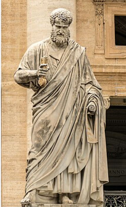
Het beeld van Sint-Petrus buiten vóór de Sint-Pieters basiliek

29 juni is de feestdag van de heiligen Petrus en Paulus. Op deze dag wordt hun marteldood herdacht. Het is de belangrijkste patroonsdag van de stad Rome.