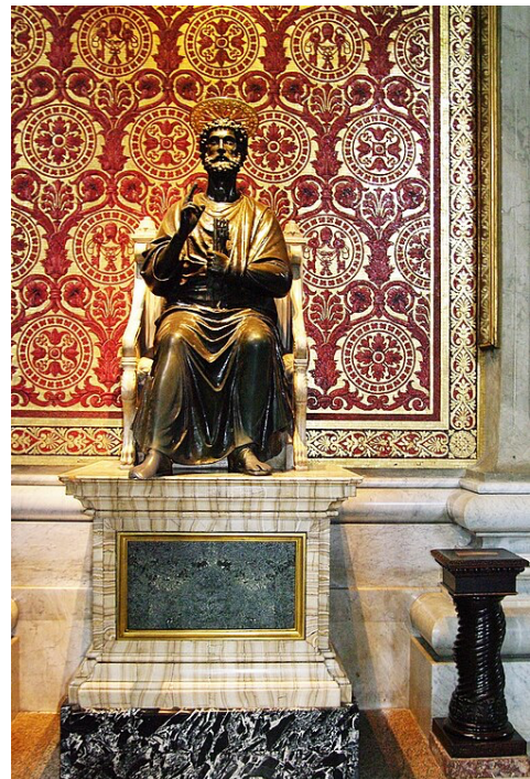
Het beeld van Sint-Petrus in de Sint-Pietersbasiliek