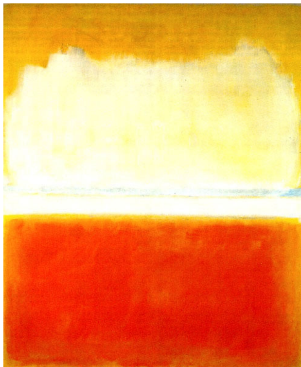
Mark Rothko, N° 8, Olie op doek, 1952, Private collectie

Bovendien is het niet simpel om je leven af te stemmen op een 'Jij' dat je niet kent. Wij weten niet hoe God is en wat God wezenlijk is. En hoe gelovig ook, geen mens hoort Gods stem permanent. Mijn geloof kent net als mijn leven momenten waarop ik Gods zwijgen ervaar, zoals Jezus in Gethsemane en aan het kruis. Het enige wat je kan doen is vertrouwen en hopen dat die God niet blind of doof is, niet onverschillig of stom en dat je hem met 'Jij' kan aanspreken. Maar die 'Jij' is hoe dan ook niet in lijntjes te vatten, noch op papier noch op het doek. Maar soms komt een zeldzame kunstenaar er wel heel dichtbij. Voor mij is dat zondermeer de Amerikaan Mark Rothko (1903-1970).