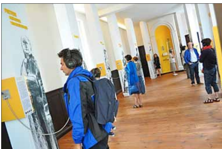
Twaalf aangrijpende levensverhalen gidsen de bezoeker door de onnoembare gruwel van de oorlogsjaren.