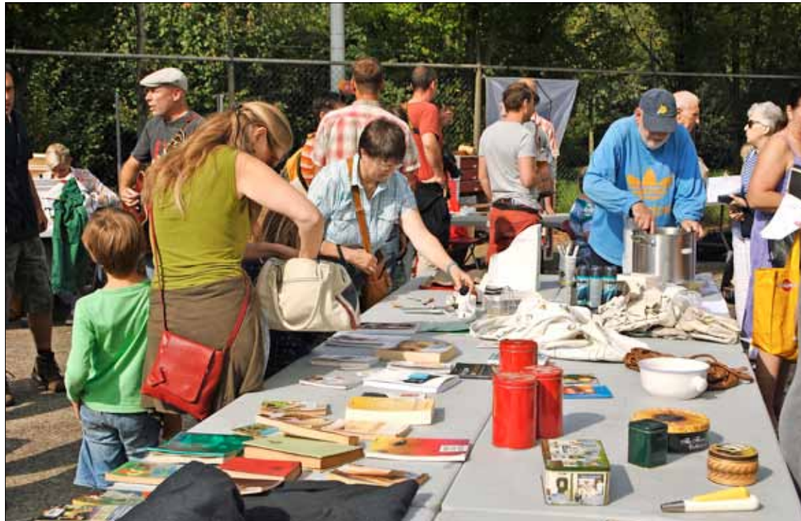
Op een 'weggeefplein' nemen mensen weg en vullen anderen weer aan.

In afwachting snuffelen we voort op andere 'delensites'. Via online-weggeefwinkel.be geven mensen allerlei dingen gratis weg, van een metalen koffieblik tot scheuten van een grasplant. Voldoende eendjes met vishaak verzamelen, is dan weer de droom van een kleuterjuf. Zelfs op de website tweedehands.be blijken opmerkelijk veel gratis aanbiedingen te vinden. „Gratis haantjes, op voorwaarde dat je zelf komt vangen”, lezen we.