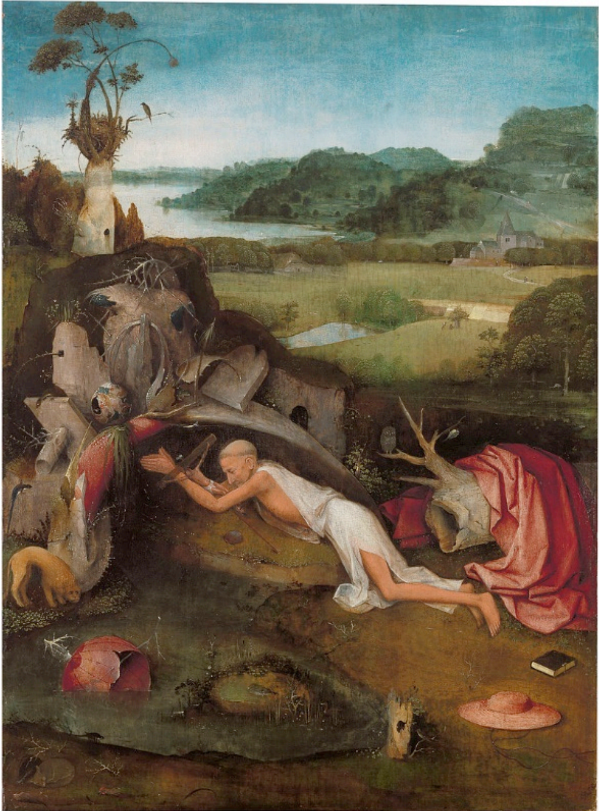
‘De heilige Hiëronymus in gebed’, Jheronimus Bosch, ca 1482 (MSK Gent)