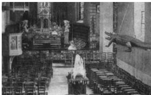
postkaart vóór 1961