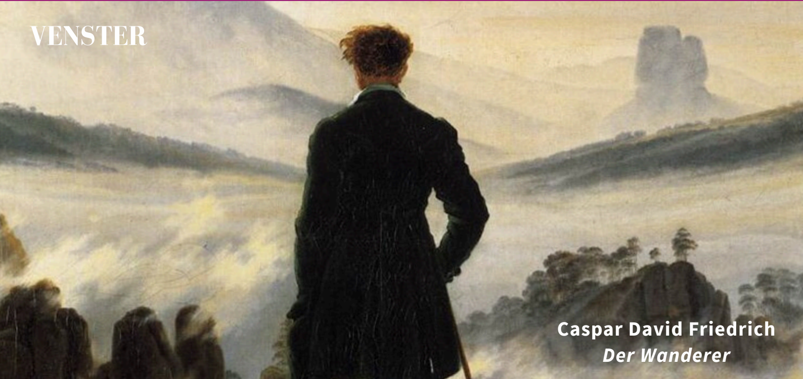
Caspar David Friedrich Der Wanderer