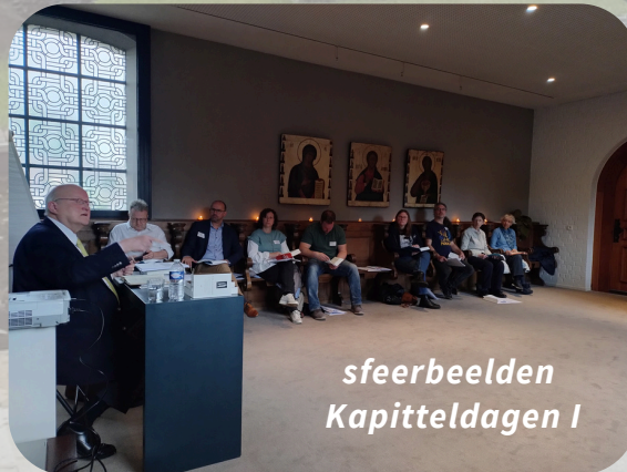
sfeerbeelden Kapitteldagen I

BRUSK is de gloednieuwe artistieke hotspot in het hart van Brugge. Een kunsthall -geen museum- voor tentoonstellingen en evenementen van topniveau. Op dit moment loopt onder meer de tentoonstelling Latent City van de Turks-Amerikaanse kunstenaar Refik Anadol . Op 31 mei is er een familiedag . Meer weten