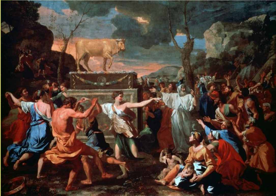
Adoration of the Golden Calf , oil on canvas by Nicolas Poussin