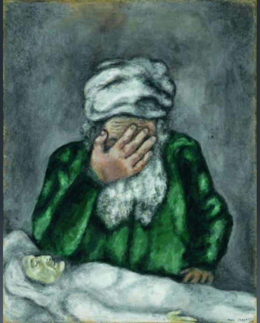
Marc Chagall, Abraham beweent Sara