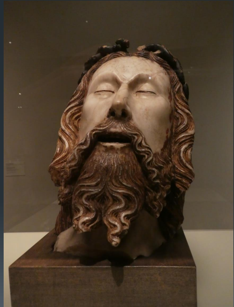
Barcelona Nationaal museum Catalaanse kunst