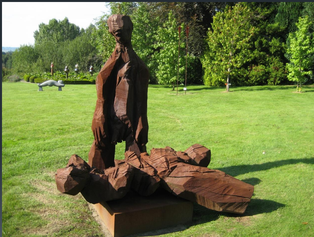
Klaus Prior, Piëta