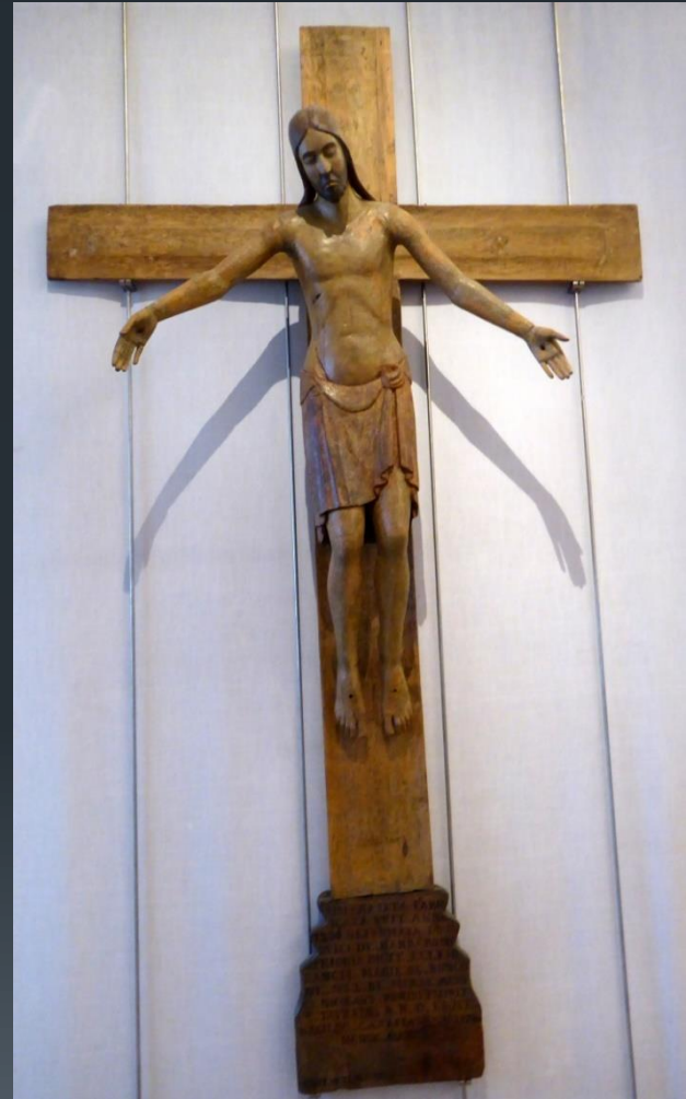
Perugia 18 de eeuw Nationaal museum van Umbrië