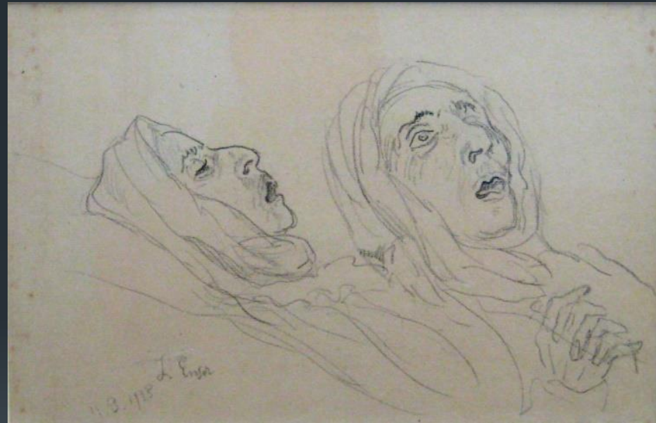
James Ensor, Mijn dode moeder III