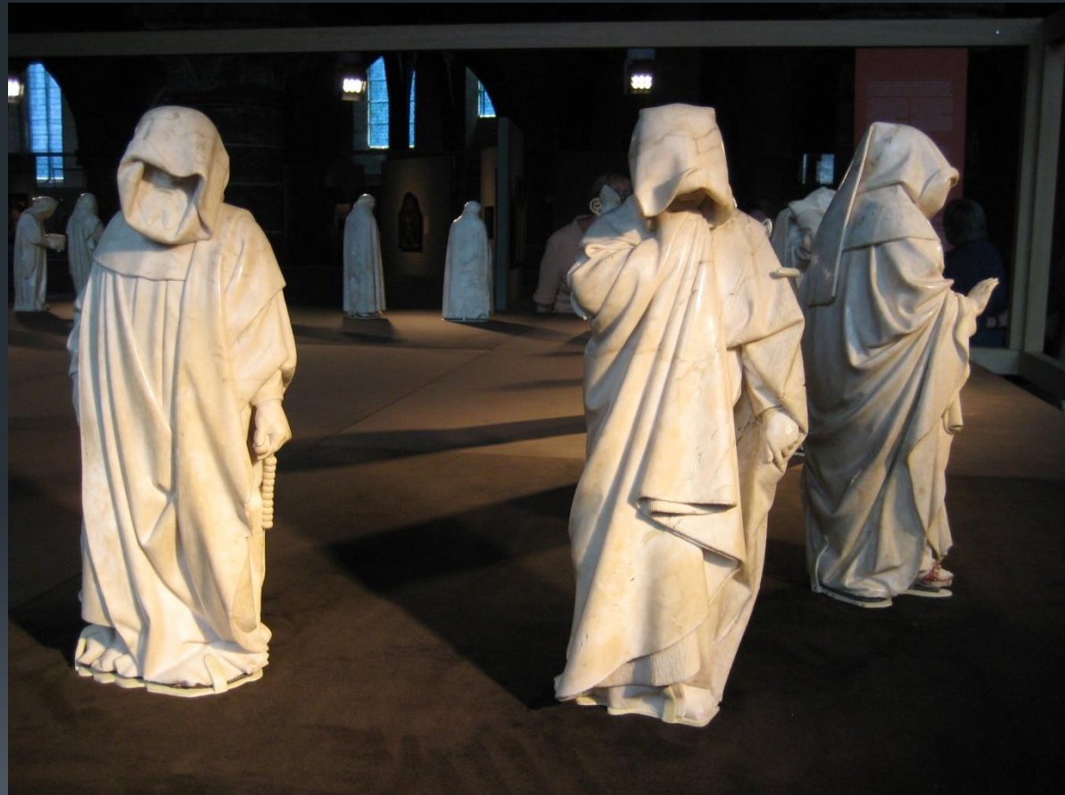
Pleurants bij graf van Jan zonder Vrees