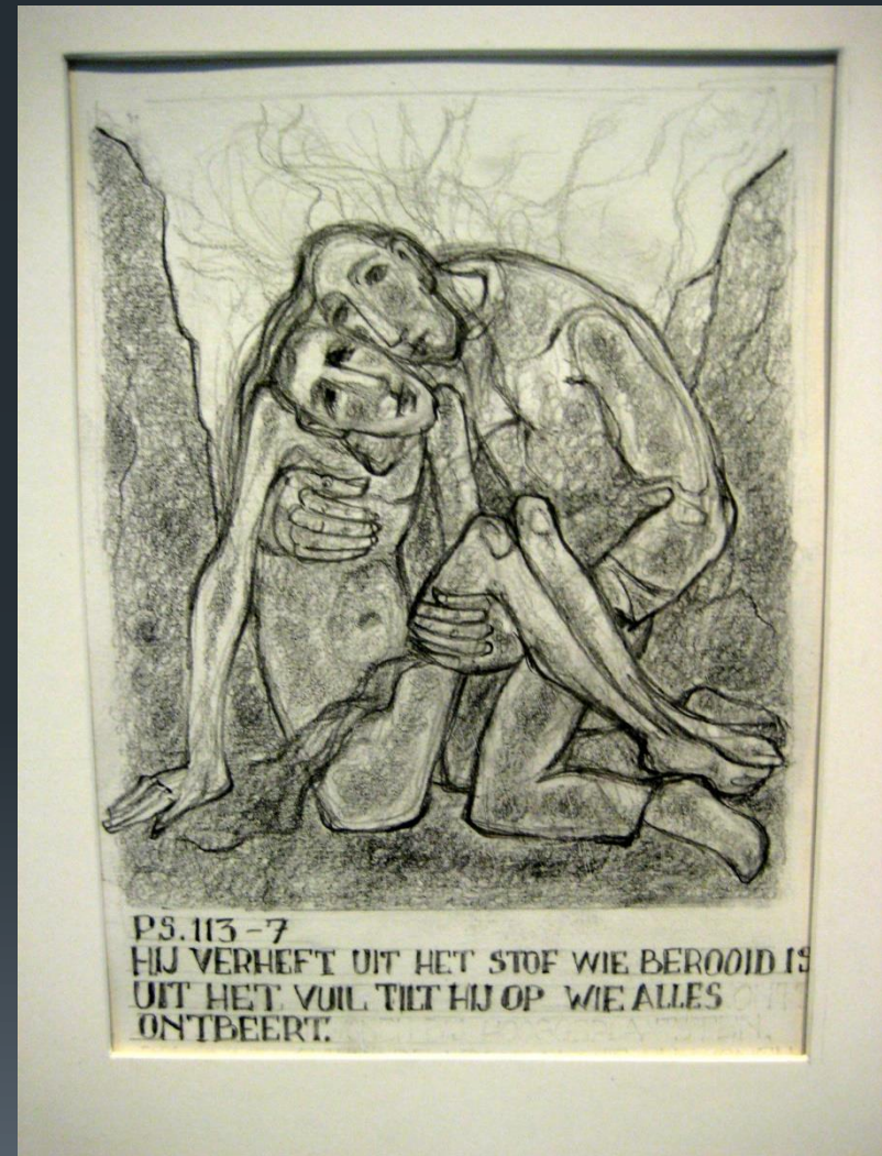
Sjeff Hutschemakers, Ps 113,7