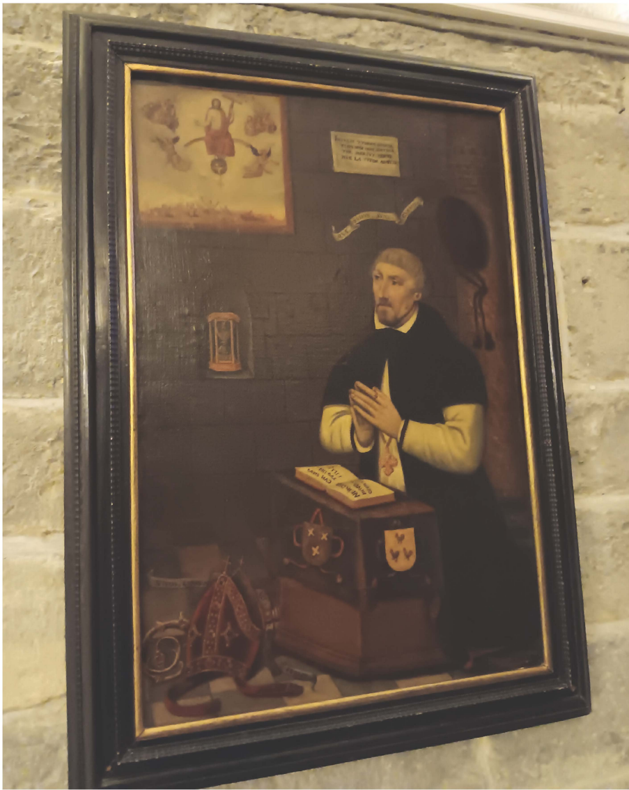
Bisschop Gulielmus Van der Lindt of Lindanus (+ 1588) - crypte Sint-Baafskathedraal

► Over de daaropvolgende periode onder bisschop Damant, 1590-1609, is weinig geweten. Het lijkt er op dat het vooral het Sint-Baafskapittel was dat zich om het reilen en zeilen van het seminarie bekommerde en de vraag kan worden gesteld of de opleiding zich niet beperkte tot die van een soort "Latijnse School", hoewel andere historische bronnen dan toch weer melding maken van theologisch onderwijs. Vanaf 1607 is evenwel een duidelijke kentering waarneembaar en vanaf die datum zetten de bisschoppen Karel Maes (1610-1612) en Hendrik van der Burch (1613-1616) zich echt in om een degelijke priesteropleiding in hun seminarie te organiseren en werden de