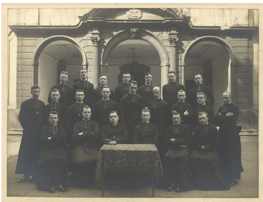
Seminaristen voor de ingang

Op 27 juli 1813 liet de prefect van het Schelvedepartement het seminarie sluiten om het verzet van de seminaristen en de seminarieoverheid tegen de door Napoleon benoemde bisschop de la Brue als vervanger van de gevangen genomen de Broglie, te breken. De seminaristen werden gelaïciseerd en ingelijfd in het leger en naar Wezel of Parijs gestuurd. Drieënveertig van hen overleden daar of op reis. Intussen werd door de la Brue in Gent een schijnseminarie ingericht, dat evenwel zo goed als geen