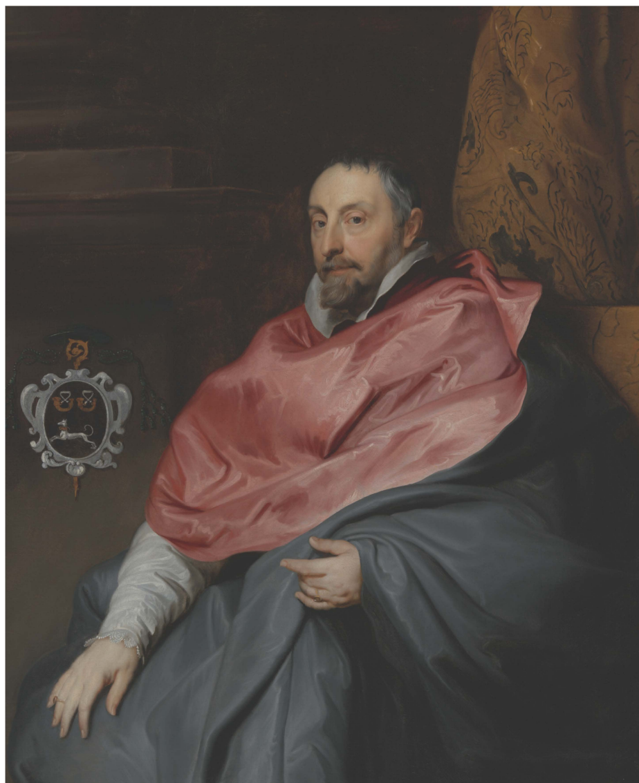
Portret van bisschop Triest, anoniem, Stichting Cultuurpatrimonium Bisdom Gent

De theologanten stuurde Triest vanaf 1622 naar de universiteit, vooral naar Douai, anderen naar Leuven.