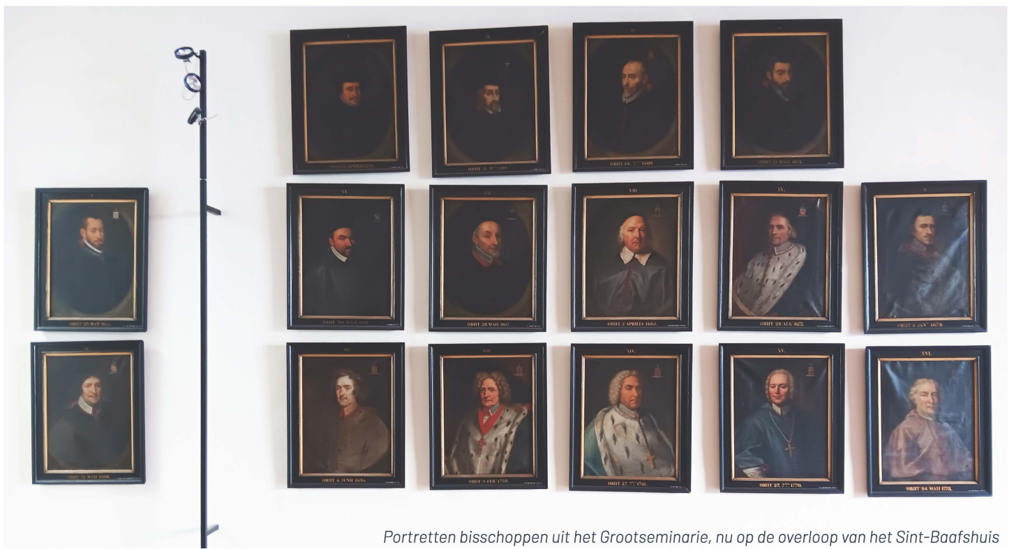
Portretten bisschoppen uit het Grootseminarie, nu op de overloep van het Sint-Baafshuis