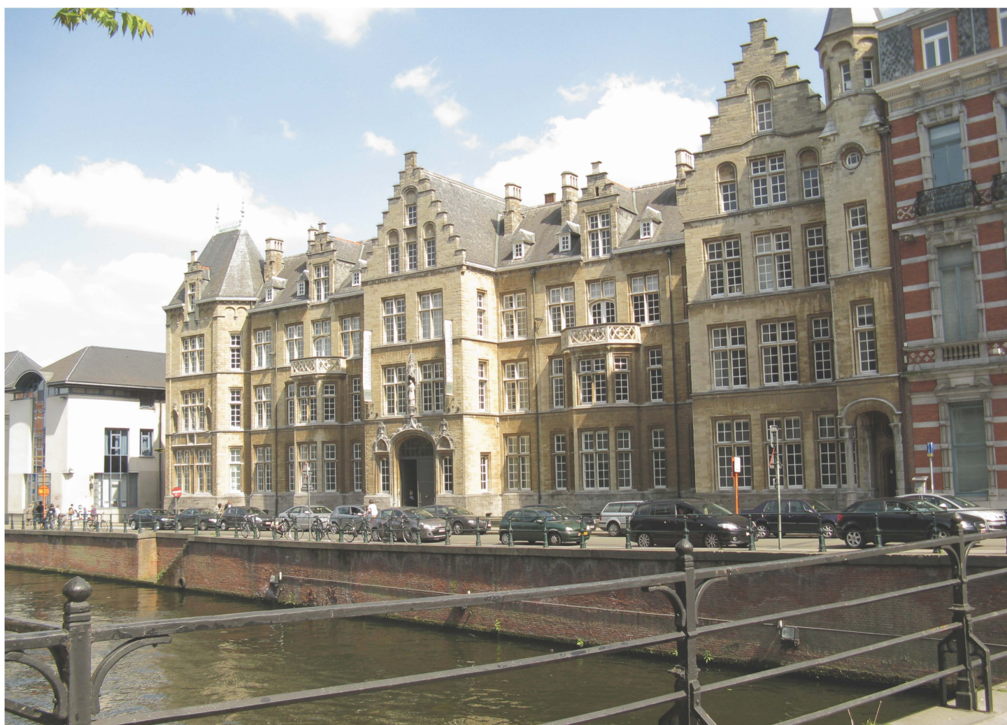
Grootseminarie aan De Reep