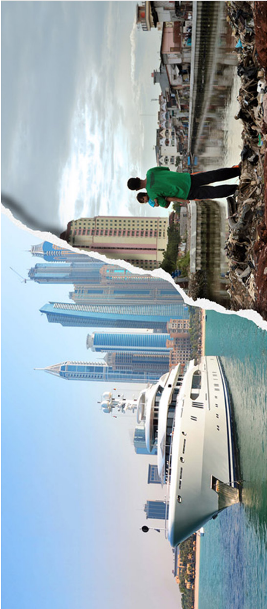
BIJLAGE 6 - (KNIP DEZE FOTO IN PUZZELSTUKKEN)