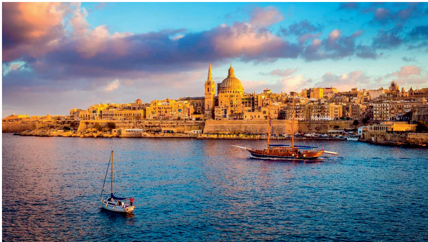
Zicht op het eiland Malta met de katholieke Sint-Pauluskathedraal en de anglicaanse pro-cathedral.