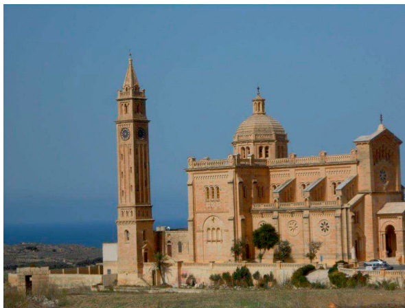
Ta' Pinu, sanctuaire national ( Għarb sur l'île de Gozo )

De gekozen datum is geen toeval. De derde zondag van het kerkelijk jaar situeert zich op het einde van januari, in 2020 op 26 januari. Het is het moment van het jaar waarop gelovigen worden uitgenodigd om de relaties met de joodse gemeenschap te bevorderen en te bidden voor de eenheid van de christenen. Voor de paus heeft de viering van de Zondag van het Woord van God een oecumenische betekenis. Zij die de Schrift beluisteren, gaan samen op weg naar een authentieke en hechte eenheid.