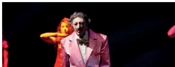
Pippo Delbono, Vangelo

Na de voorstelling is er een nabespreking met Pippo Delbono