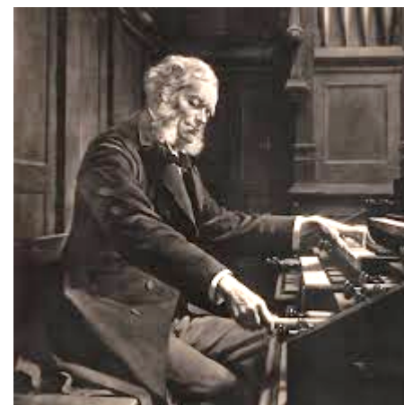
César Franck aan het orgel

De relatief korte repetities na de vieringen op zondag waren efficiënt en effectief. Ze werden stevast afgesloten met een gezellige drank in de ontmoetingsruimte.