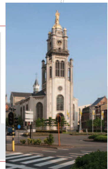
maans-byzantijnse stijl naar een ontwerp van Lodewijk Roelandt.

Route: rechts in Westerstraat, rond Westerplein, Aerschotstraat 41 Muurkapel Onze-Lieve-Vrouw, Aerschotstraat (tegenover nr. 49) Route: verder in Aerschotstraat, links in Dalstraat, rechts in Plezantstraat, Onze-Lieve-Vrouwplein 42 Parochiekerk Onze-Lieve-Vrouw Bijstand der Christenen, Onze-Lieve-Vrouwplein In 1841-1844 gebouwd in neoro-