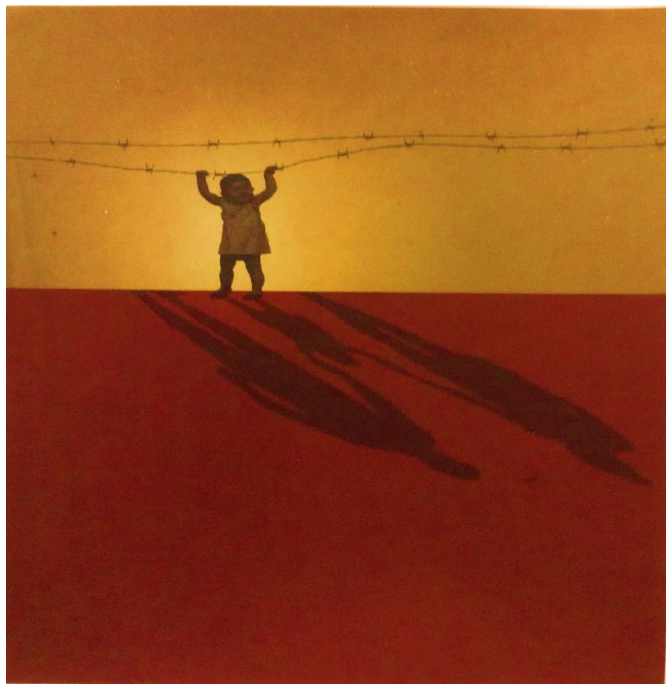
'foto genomen van een kindertekening in Theresienstadt'.

Verbinden, verbindingen maken, met jezelf, met medemensen, met God, met de natuur, kun jij het?