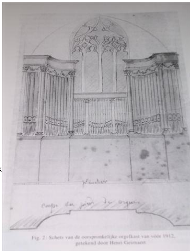
Fig. 2: Schets van de oorspronkelijke orgelkast van vóór 1912, getekend door Henri Geirnaert

Het wordt de Gentse bouwkundige Henri Geirnaert, wonende aan de Ottogracht. Geirnaert is een oude bekende van de kerkfabriek, hij is immers de man die in 1891 de nieuwe neogotische Wittentakkapel opgetrokken heeft. Op 15 december 1911 schrijft hij de kerkfabriek aan. De plannen die hij tekent om orgelfront, oksaal en hoofdportaal in een uniform neogotisch kleed te steken, zijn bewaard in de dekenij. Hij raamt de werken op ruim 11 000 fr., het werk van de orgelbouwer uiteraard niet meegerekend. Omdat deze prijs de pan uitrijst vraagt hij of de kerkfabriek de mogelijkheid wil onderzoeken om 'n orgelfront 'n oksaal in zijn neoclassicistisch uitzicht te bewaren. In de vergadering van 19 november