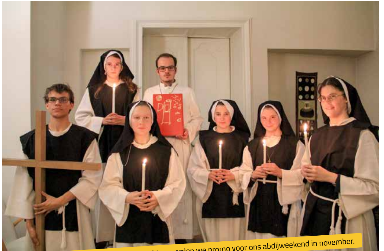
Het GPS presidium houdt van ludieke acties: hier voerden we promo voor ons abdijsweekend in november.

Contactgegevens GPS: Studenten.ugent.be/GPS – gps.adfundum@gmail.com Nederpolder 24, Gent – 09 235 78 48