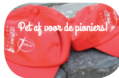
Tekst: Peter Malfliet

Die vormelingendagen, in welke formule dan ook, betekenen veel voor Hugo, Leen en Dirk. Dat merk ik in het nagesprek bij een lekkere pizza. En dat geldt zeker ook voor alle andere pioniers en steunpilaren. Eén anekdote moet Hugo nog kwijt: "Op een keer vroegen voorbijgangers me of er een betoging bezig was van de socialistische vakbond omdat er allemaal mensen voorbijkwamen met rode petjes. Gelukkig kwam toen ook de groep met de groene petjes aan op het plein..." Of het nu een rood, groen, blauw of oranje petje is: