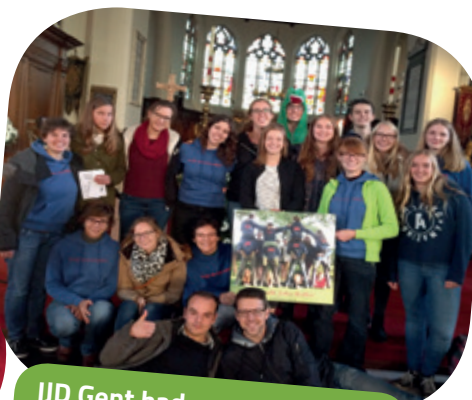
IJD Gent had voor onze groep een mooi aandenken mee