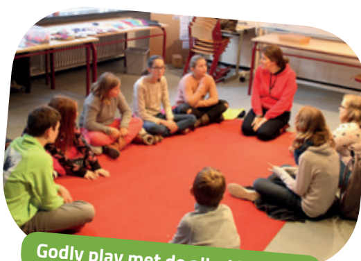
Godly play met de allerkleinsten