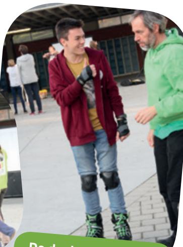
De deelnemers zagen dat het goed was