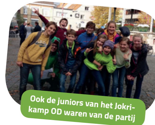
Ook de juniors van het Jokri-kamp OD waren van de partij