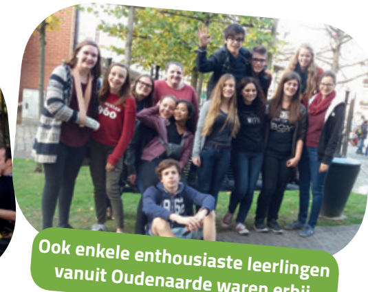
Ook enkele enthousiaste leerlingen vanuit Oudenaarde waren erbij