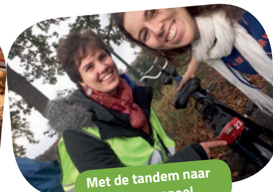
Met de tandem naar de Kraenepoel