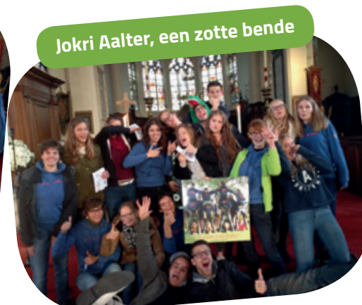
Jokri Aalter, een zotte bende