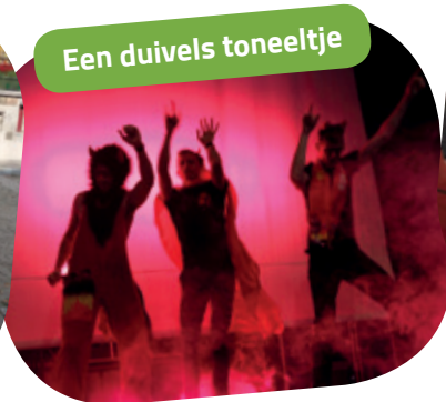
Een duivels toneeltje