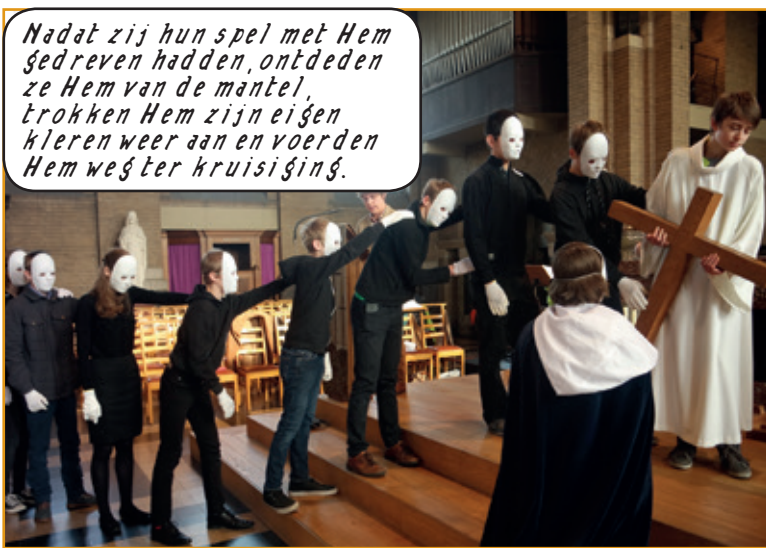
Nadat zij hun spel met Hem gedreven hadden, ontdeden ze Hem van de mantel, trokken Hem zijn eigen kleren weer aan en voerden Hem weg ter kruisiging.