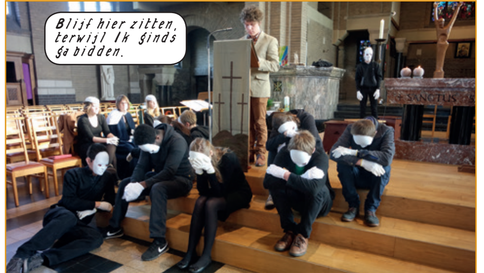
Blijf hier zitten, terwijl ik ginds ga bidden.