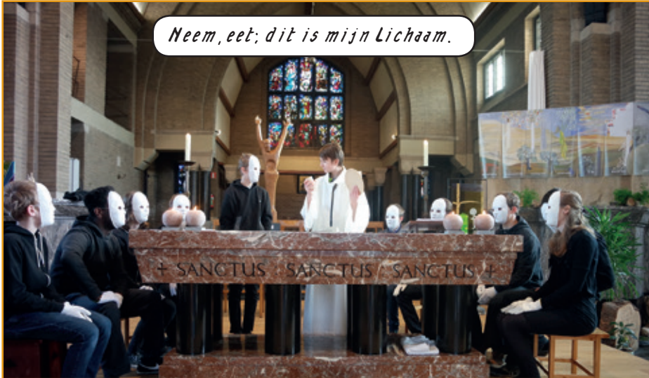
Neem, eet; dit is mijn Lichaam.