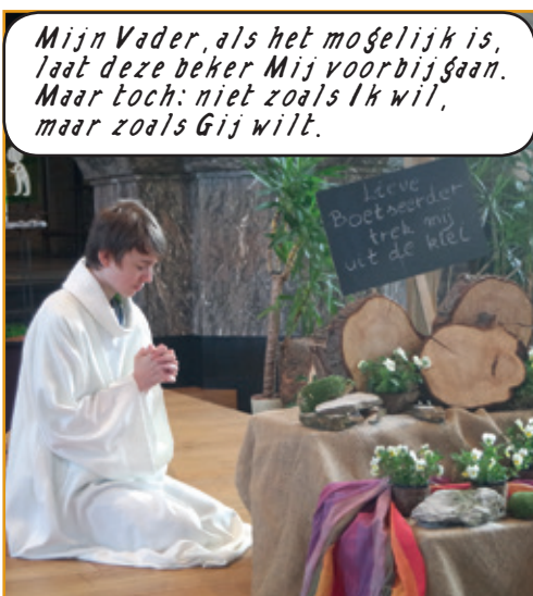
Mijn Vader, als het mogelijk is, laat deze beker Mij voorbijgaan. Maar toch: niet zoals ik wil, maar zoals Gij wilt.