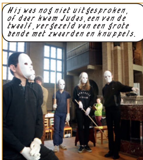
Hij was nog niet uitgesproken, of daar kwam Judas, een van de twaalf, vergezeld van een grote bende met zwaarden en knuppels.