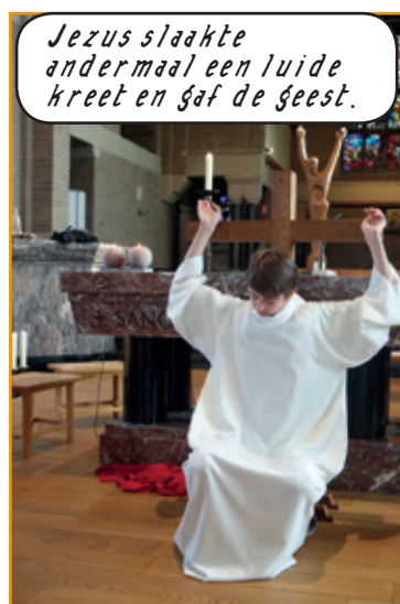
Jezus slaakte andermaal een luide kreet en gaf de geest.