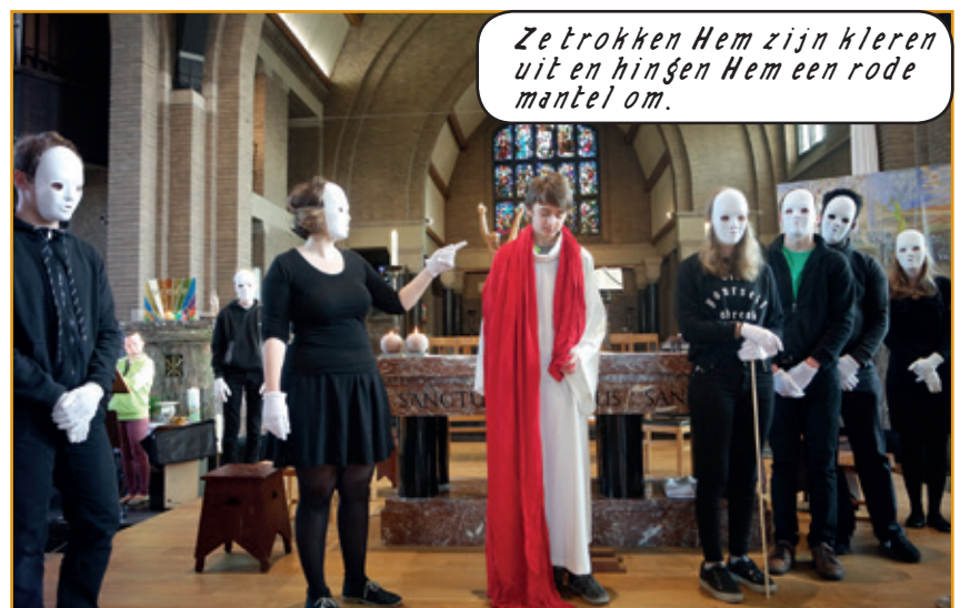
Ze trokken Hem zijn kleren uit en hingen Hem een rode mantel om.