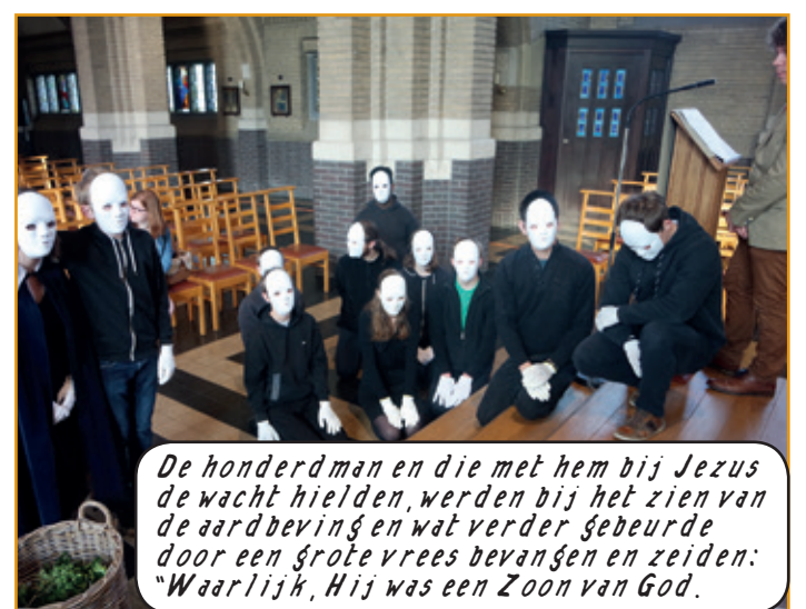
De honderdman en die met hem bij Jezus de wacht hielden, werden bij het zien van de aardbeving en wat verder gebeurde door een grote vrees bevangen en zeiden: "Waarlijk, Hij was een Zoon van God."