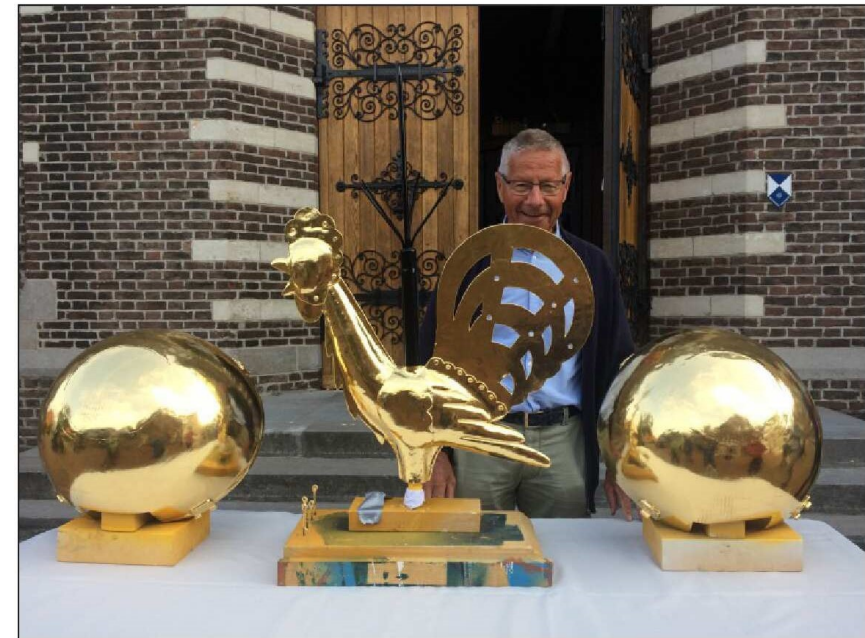
De nieuw-vergulde torenhaan mag weer de toren op