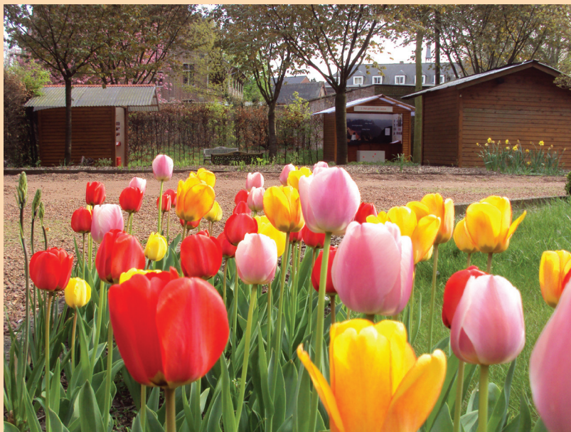
De blokhutten in Oostakker

de mensen en meevoelen met hen. Is het niet?"