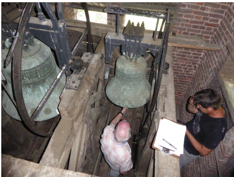
De klokkenjagers aan het werk

De eerste klok werd in april 1944 weggehaald door de Duitse bezetter. Dit ging niet zonder slag noch stoot: eerst had men de kerkdeur afgesloten maar later geopend om erger te voorkomen. Boven de poort werd een raam uitgekapt waardoor de klok werd afgelaten. Meer informatie over de klokkenroof van 1943 kan gevonden worden in [3] en [6].