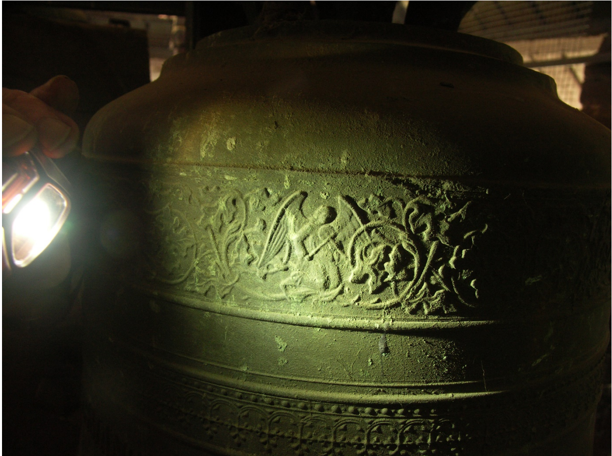
Een detail van de sierband met musicerende engelen op de Jan Berchmansklok

Boven de faussure zijn dan nog drie gietringen aangebracht.