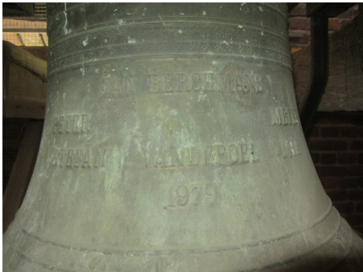
De tekst op de Jan Berchmansklok