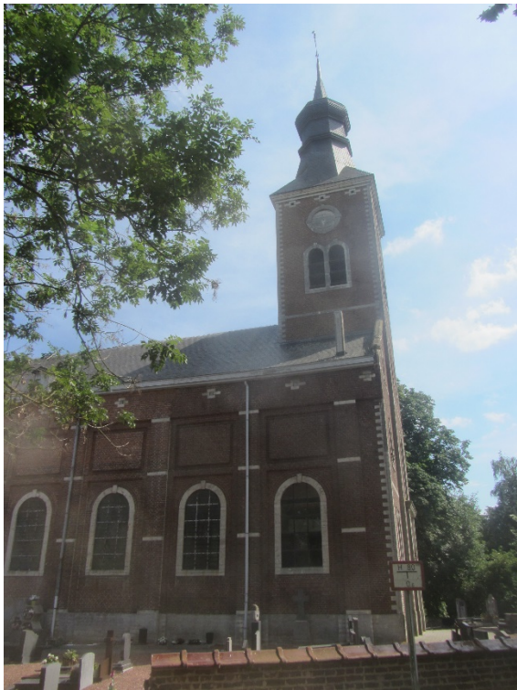
De kerk van Kersbeek