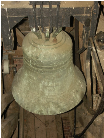
De Jan Berchmansklok