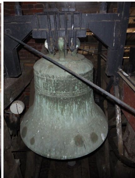
De klok Vrede