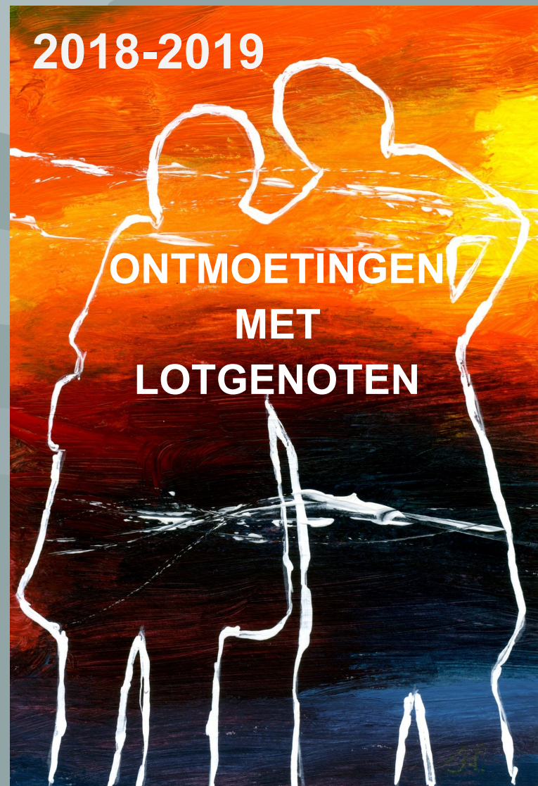
Illustratie: Sabine Pirlot

Rouw is iets wat je zelf moet verwerken, ieder op eigen wijze en ritme. De aanwezigheid, aandacht en warmte van anderen daarbij, maken dat je een tochtgenoot hebt die de last als het ware helpt dragen, helpt ver-dragen. Agnes