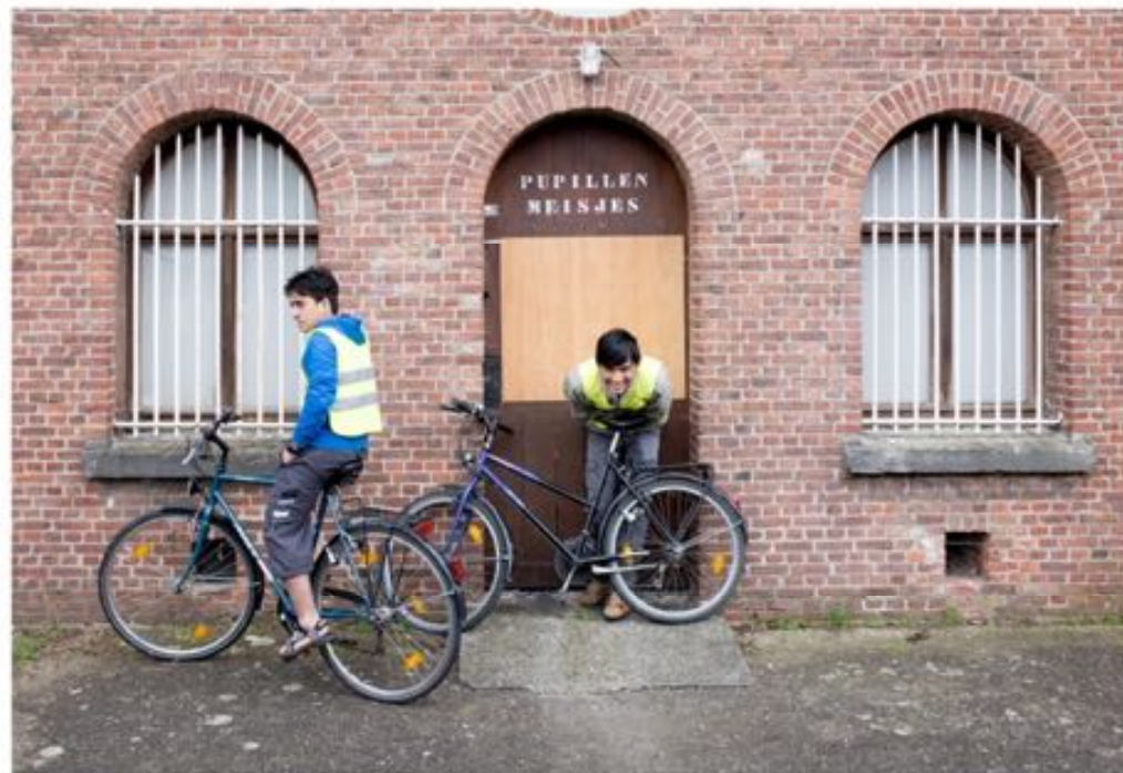
De bewoners van het opvangcentrum in Zeijndrecht kregen fietsjes van de politie. Maar een woning vinden, dat is voor een vluchteling een ander paar mouwen.

BURGERS SLAAN HANDEN IN ELKAAR OM VLUCHTELINGEN AAN VERBLIJF TE HELPEN