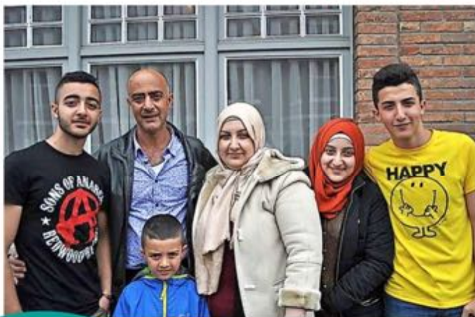
Familieportret van het Syrisch gezin in Brugge

Meer solidariteit is nog altijd heel welkom! Want de tijdsdruk is groot. Na hun erkenning moeten vluchtelingen hun lokale opvanginitiatief binnen 2 maanden verlaten. Vaak moeten ze zonder hulp op zoek naar een woning. Hun sociale netwerk is heel beperkt, ze spreken amper Nederlands en de woningmarkt in Vlaanderen versterkt de discriminatie op de private huurmarkt. Een gezin dat niet op tijd een woning vindt, riskeert dakloos te worden.