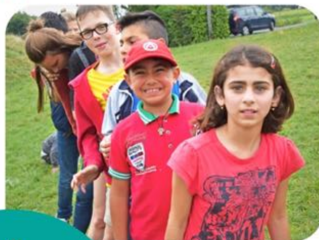
Foto: Op tinerkamp met de Sint-Michielsbeweging

De tijdsdruk is hoog. Na hun erkenning moeten vluchtelingen hun lokale opvanginitiatief binnen de twee maanden verlaten. Wie niet op tijd een huurwoning vindt komt op straat terecht of in de daklozenopvang.