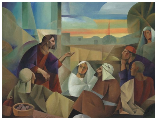
The Lord of the Parables (2018), Jorge Cocco Santàngelo