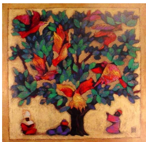
Nelly Bube (Kazachstan), Mustard Seed