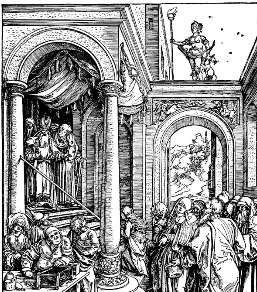
Albrecht Dürer: De tempelgang van Maria (1504)