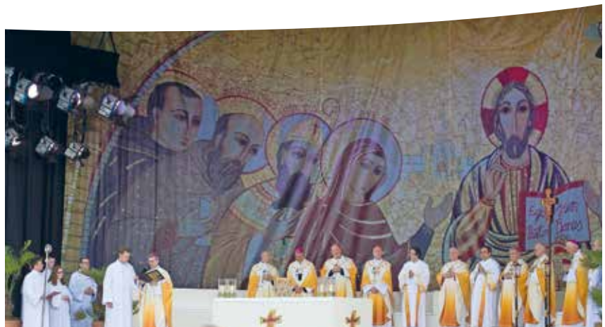
Het vorige Eucharistische Congres had in 2012 plaats in Dublin (Ierland).