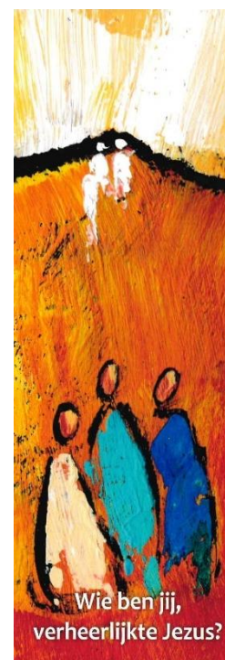
Wie ben jij, verheerlijkte Jezus?

Witter dan wit ben bij. Ik knipper met mijn ogen. Ik ben verward. Ik schrik, zoals Petrus. Tegelijk, en dat is het sterkst, voel ik diepe vreugde. Wie ben jij dat je mijn ogen met zo'n schittering verblijdt? Wie ben jij dat je mijn hart vult met eerbiedige verering en doet branden van liefde? En wie ben ik, Heer, dat ik tot zoveel schoonheid zou naderen? Ik hoor de stem in de wolk, ik hoor de zuivere liefde aan het woord, ik zie hoe Vader en Zoon elkaar liefhebben en verheug mij in stilte. Een wonder, deze liefde,