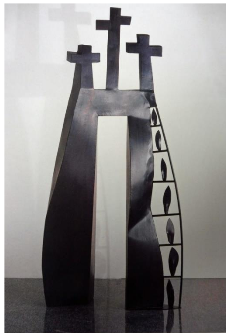
Angelo Casciello, °1957, Scafati, Italië GOLGOTHA - Beschilderd ijzer