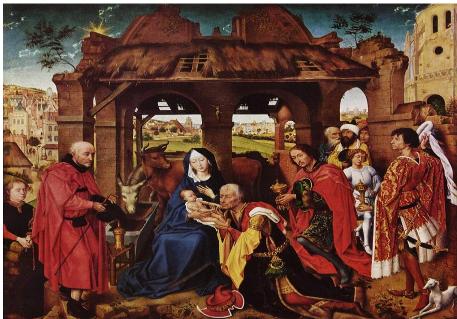
De Drie Wijzen – Rogier van der Weyden

Bach: Weihnachtsoratorium BWV 248 - Cantate no.6