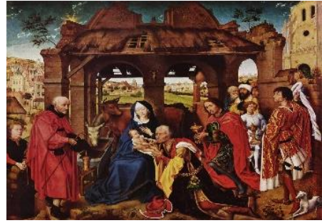
De Drie Wijzen – Rogier van der Weyden

God, U die over alle grenzen heen uw Zoon aan mensen hebt gegeven, wij vragen U: maak ons ontvankelijk voor uw Blijde Boodschap, zodat wij ook over alle grenzen heen uw Licht in de wereld doorgeven, daarin geleid door Jezus, uw Zoon, die met U en de heilige Geest leeft in eeuwigheid. Amen.