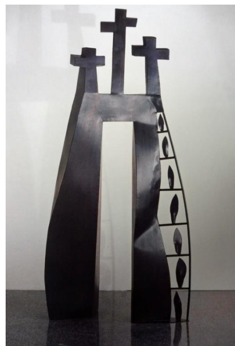
Angelo Casciello, *1957, Scafati, Italië GOLGOTHA - Beschilderd ijzer

We hebben het daar heel vaak moeilijk mee. Omdat het moeilijk is, sowieso. Maar ook omdat er rondom ons, of juist bij ons, dingen gebeuren waarvan de diepere zin verborgen blijft of die juist niet de minste zin hebben. Of ook omdat we zelf nog te weinig liefde