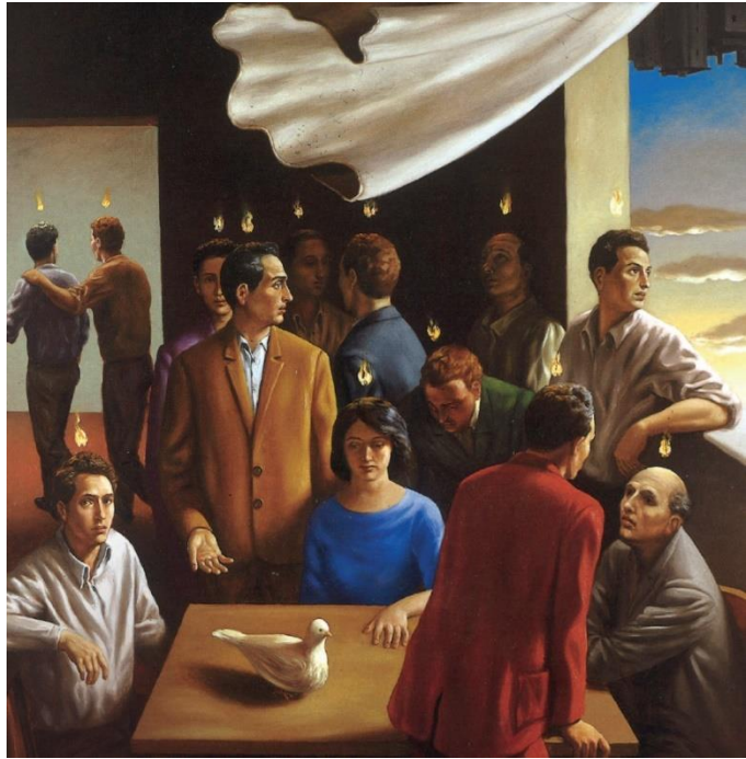
Pinksteren (Stefano di Stasio, olie op doek, 1998). Wind, duif, vuur, alle elementen die verwijzen naar de heilige Geest zijn aanwezig op dit doek. Maar de mensen schijnen het nog te moeten voelen en moeten nog in beweging komen.

Stort uw Vuur uit over de woorden van mensen, over het zwijgen van mensen,