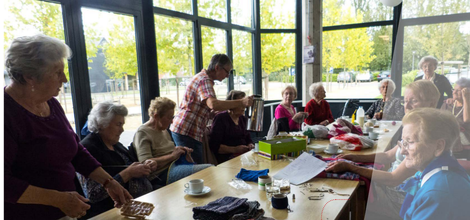
Ouderen ontmoeten elkaar in het woon- en zorghuis Ten Kerselaere

Verbonden zijn met elkaar doet deugd. Hier op het slotfeest van het bisdom.