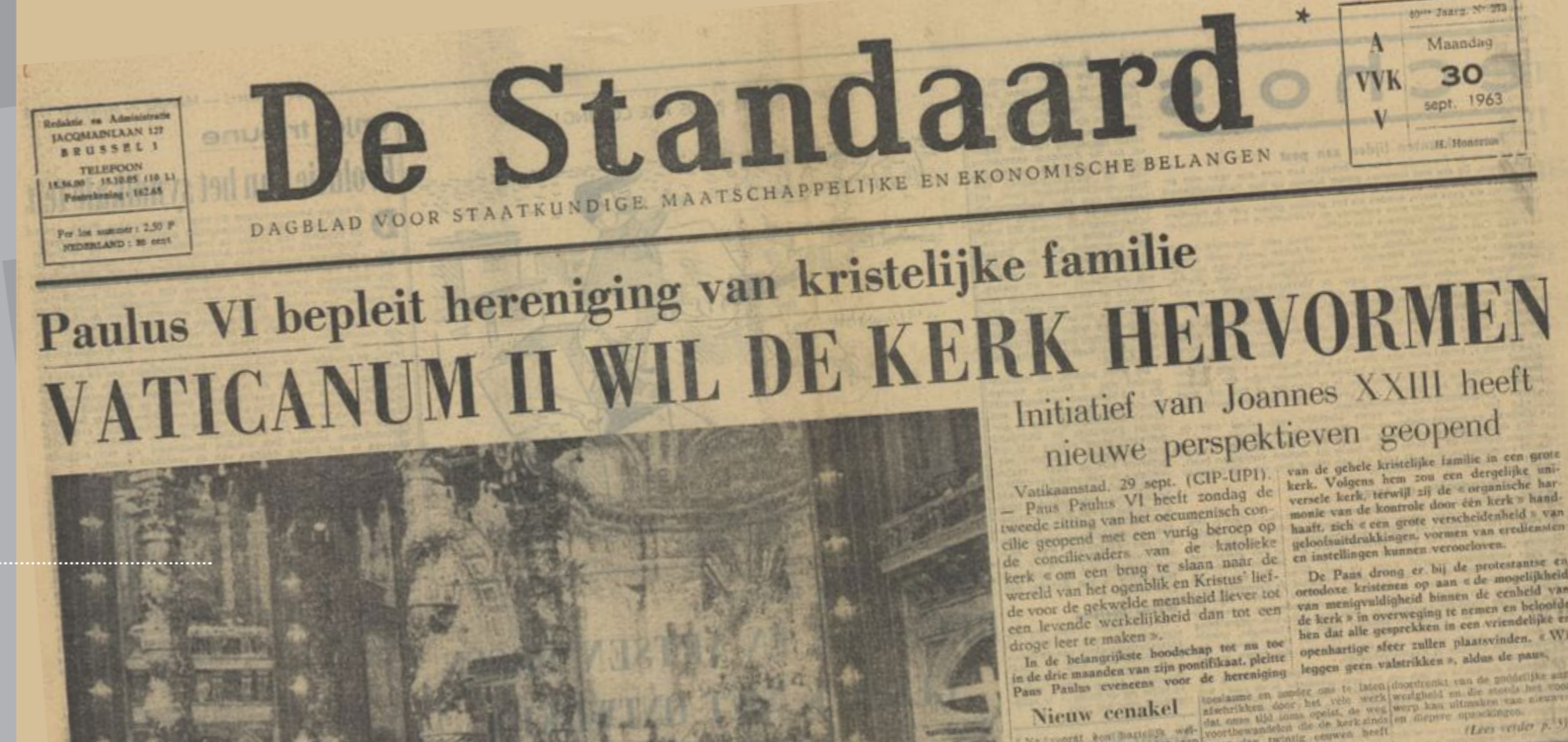
Het Tweede Vaticaans Concilie, dat paus Johannes XXIII tot verrassing van velen samenriep, was voorpaginanieuws.

Vijftig jaar geleden ging het Tweede Vaticaans Concilie van start. De documenten die over drie jaar tijd verschenen (1962-1965) zouden de Kerk in een andere verhouding plaatsen tot de wereld zoals die zich toen ontwikkelde. Dat was een nieuw gegeven in de kerk-geschiedenis.