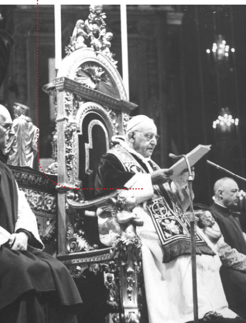
Johannes XXIII opent het Tweede Vaticaans Concilie.

Vijftig jaar geleden ging het Tweede Vaticaans Concilie van start. De documenten die over drie jaar tijd verschenen (1962-1965) zouden de Kerk in een andere verhouding plaatsen tot de wereld zoals die zich toen ontwikkelde. Dat was een nieuw gegeven in de kerkgeschiedenis.